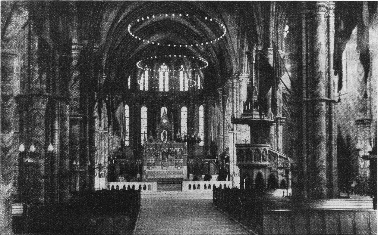
Budapest. Interieur der Krönungskirche.

die kundigsten Weltenbummler immer gesagt haben: Budapest reißt unter die schönsten Städte unserer Erde ein, und der mächtige Strom der Donau trägt viel zu ihrem Ruhme bei. Man ist versucht, zu glauben, sie stehe hier still. Wie ein ruhender See legt sie sich zwischen Buda und Pest, und einmal rahmt sie eine Insel ein, die Margareteninsel, die wie ein Garten des Paradieses das Treiben der Millionenvölkergemeinde vergessen läßt, in blühende Rosenhaine lockt und in Bäder, die nicht nur der Lustbarkeit dienen. Die heißen, der Erde entsprudelnden Wasser helfen den Rheumaleidenden und bieten ihnen die prächtigsten Plätze dar, wo sie sich tummeln und der größten Wohltäterin, der Sonne, hingeben können.