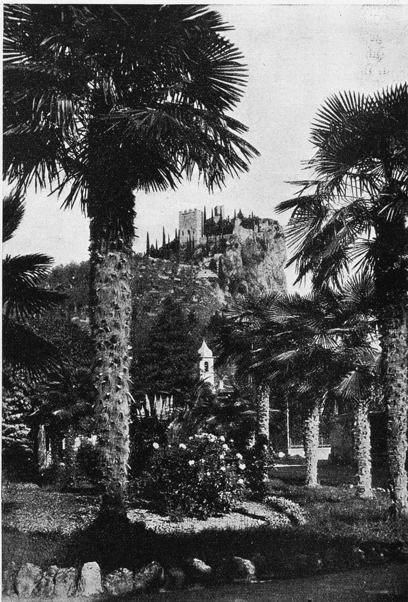
Arco (Trentino). Das Schloß.

Aber jetzt meldet sich doch etwas: eine kleine Ansammlung von Häusern — und eine Kirche dazu. Aber ich muß noch über die Brücke. Meine Karte sagt mir: Ceniga. Ein Name, den ich noch nie gehört, von dem ich nie gelesen. Aber muß denn alles an die große Glocke gehängt werden? Gottlob gibt es noch viele unbekannte Winkel in der Welt, von denen keine Geschichten gemacht werden. Das Postauto faust vorbei, wenn der Posthalter keine rote Fahne heraushängt. Meinetwegen tut er's. Die Männer hocken vor den Häusern und tubaken. Aus einer Schenke dröhnt es wie Streit. Es wird das Mora-