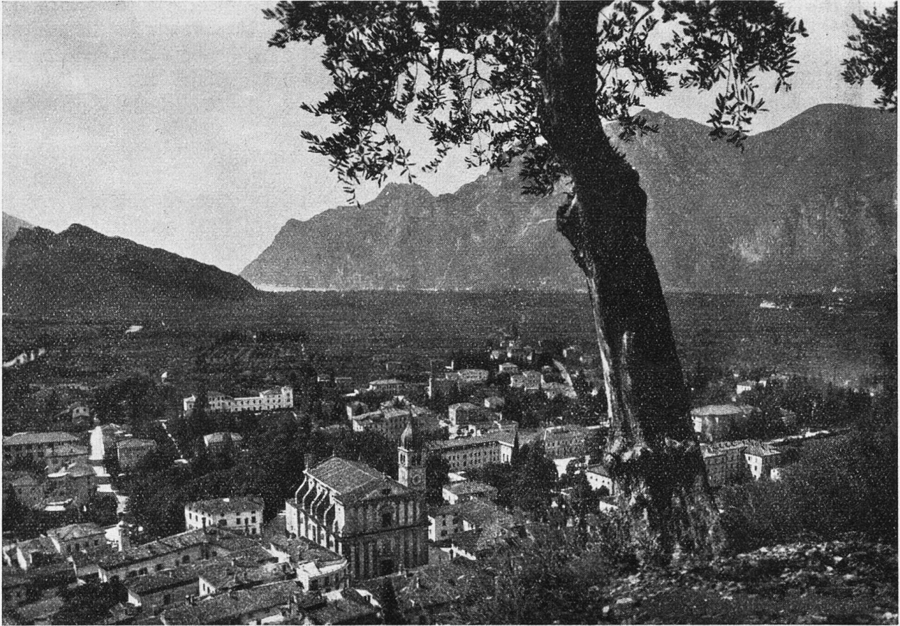
Arco (Trentino). Panorama.

genkranke hier Erholung suchen. Nervöse ruhen aus, und Herzschwache werden gestärkt. Im Bilde des Städtchens spielen schöne, große Sanatorien eine wesentliche Rolle.