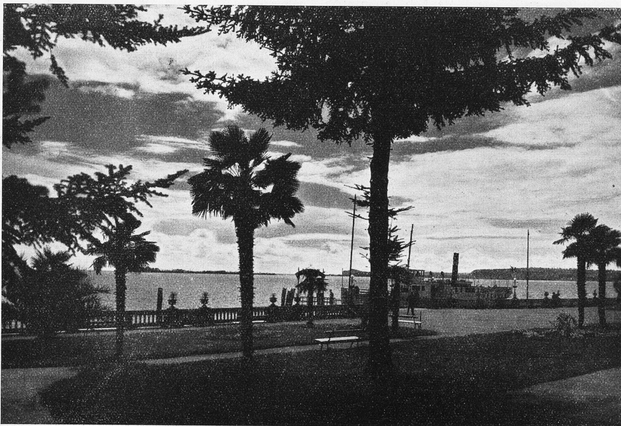
Sonnenuntergang am Gardasee.