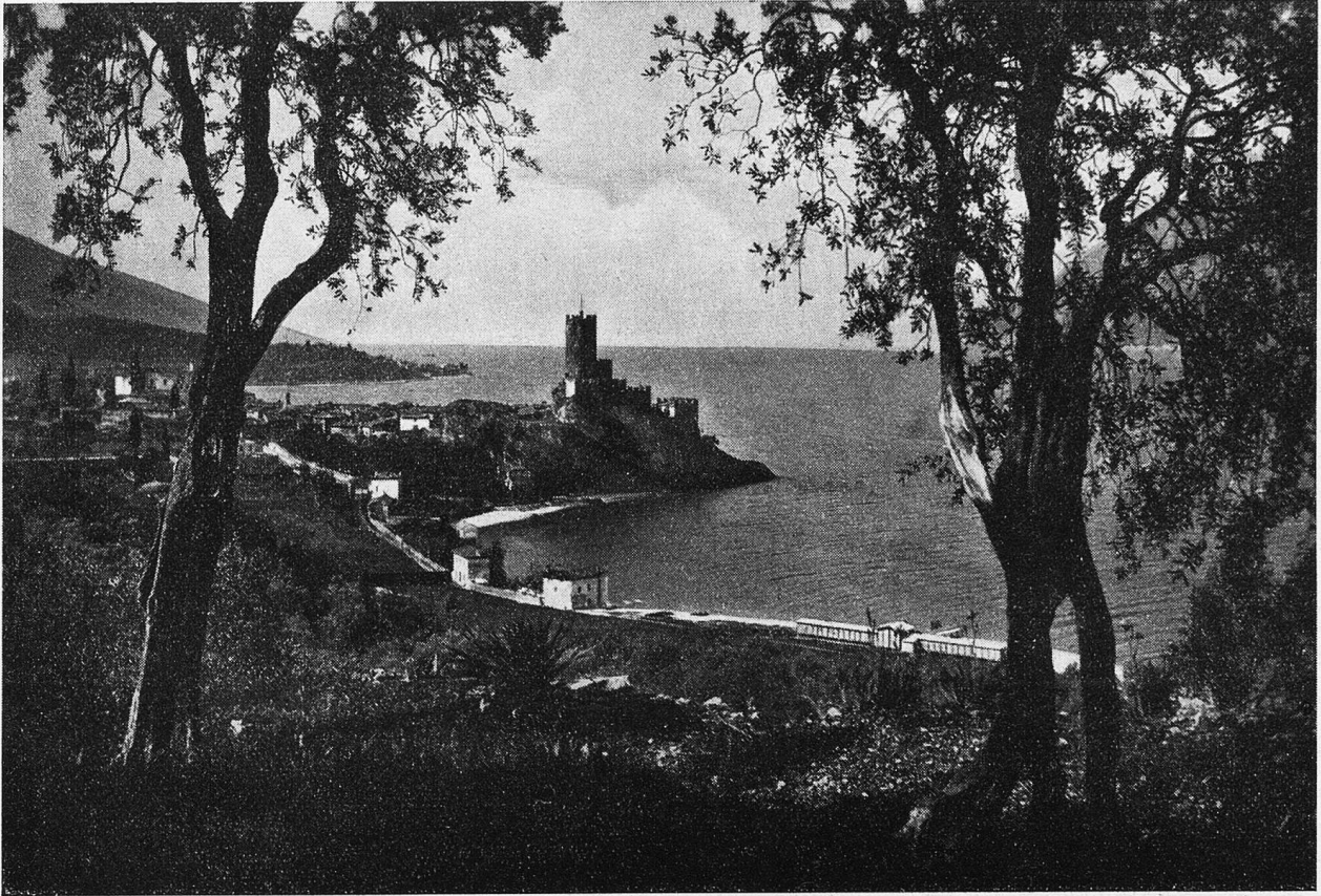
Am Gardasee. Malcesine mit Schloß.

Sie kam gekrochen, auf den gelben Fingern, wie eine große Spinne. Gerade als hätte sie Eile. Es war so lange her, seit sie Anlaß gehabt hatte, hervorzukommen. Nun mußte sie sich spalten. Sie griff förmlich nach der Feder mit den feuchten, knochigen Fingern. Es war ja falsches Spiel. Da wollte sie mit dabei sein.