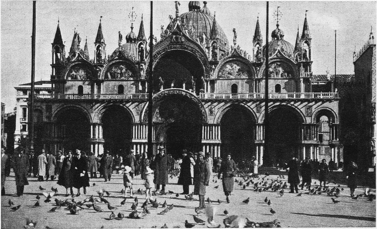
Venedig. St. Martuskirche.

Stumm warf Brahms dreimal eine Handvoll Sand auf den Sarg. Unaufhaltsam rannen die Tränen ins graue Bartgesträhn nieder.