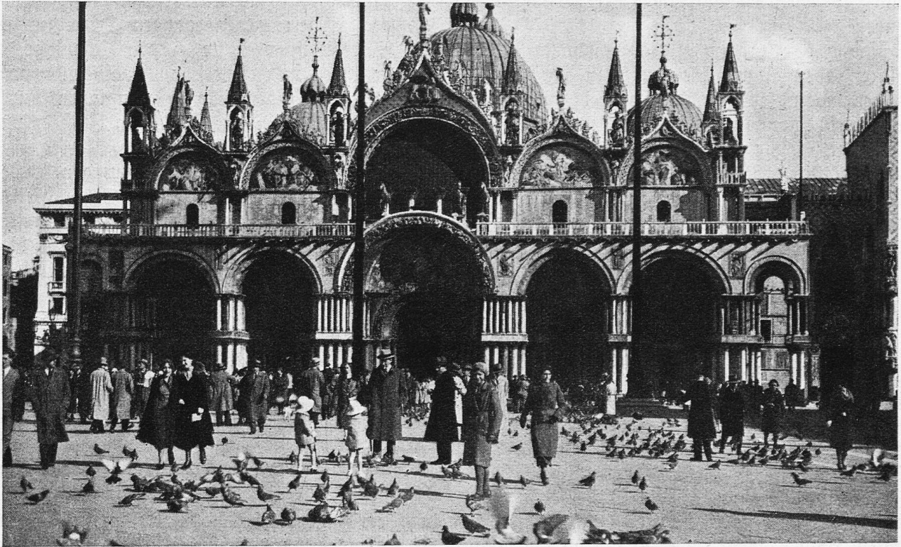
Venedig. St. Martuskirche.

Stumm warf Brahms dreimal eine Handvoll Sand auf den Sarg. Unaufhaltsam rannen die Tränen ins graue Bartgesträhn nieder.