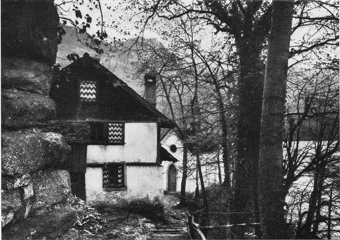
Gasthaus auf der Insel Schwanau.