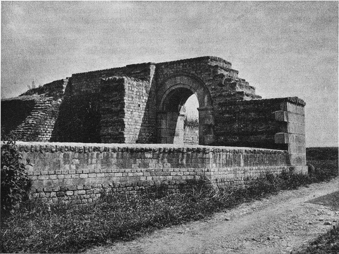
Das Osttor wurde mit den an Ort und Stelle gefundenen Steinblöcken wiederhergestellt.

aufgefundenen Gegenstände werden in einem Museum in Yverches ausgestellt. Die hier zusammengetragenen Gegenstände sind mannigfacher Art: farbige Mosaikböden, bewunderns-