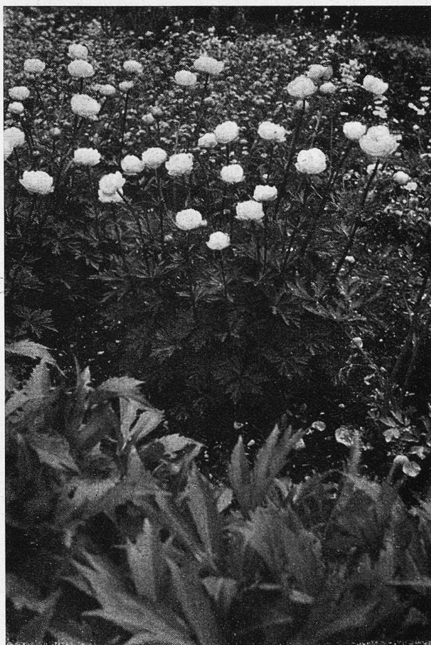
Bergblumen an den Hängen von Quinten.

Frau Lina lächelt. Wie er sich in Feuer redet!