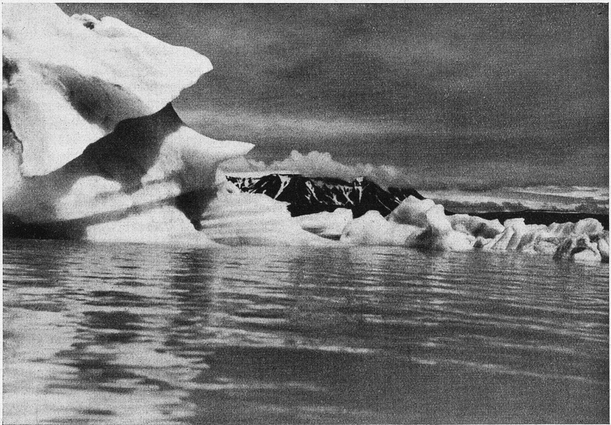
Grönland-Motiv in Island. Alte Wasserlinien des Eisberges.

Als wir unsere Boote das erstemal durch den Eisbrei des Sees schoben, in dessen Wasser sich die größten Gletscher spiegeln, und in den der Langjöfull von allen Seiten seine Steilwände hereinschiebt, hatten wir keine Ahnung von den Überraschungen, die uns hier erwarteten. Wir kreuzten bei dem 23 Stunden am Tag scheinenden Licht der manchmal auch unverhüllten Sonne und der eisstarrenden Umgebung sozusagen auf der Grenzlinie zwischen Sommer und Winter und freuten uns über die vielen neuen Eindrücke. Da wir gehört und gelesen hatten, was für eine Gewalt eine Kalbungswelle habe, und von Kennern der Verhältnisse über die Größe der Eisstürze an dieser Stelle unterrichtet worden waren, hielten wir uns immer in entsprechender Entfernung und erlebten auf diese Weise auch die erste Kalbung ungefährdet von sicherem Standpunkt aus. Trotz der Entfernung entging uns nichts von dem großartigen Naturereignis. Nach den explosionsartigen Donnereschlägen des Abbruchs wankte die hohe Eiswand in ihrer ganzen Länge, und ein breiter Streifen ver-