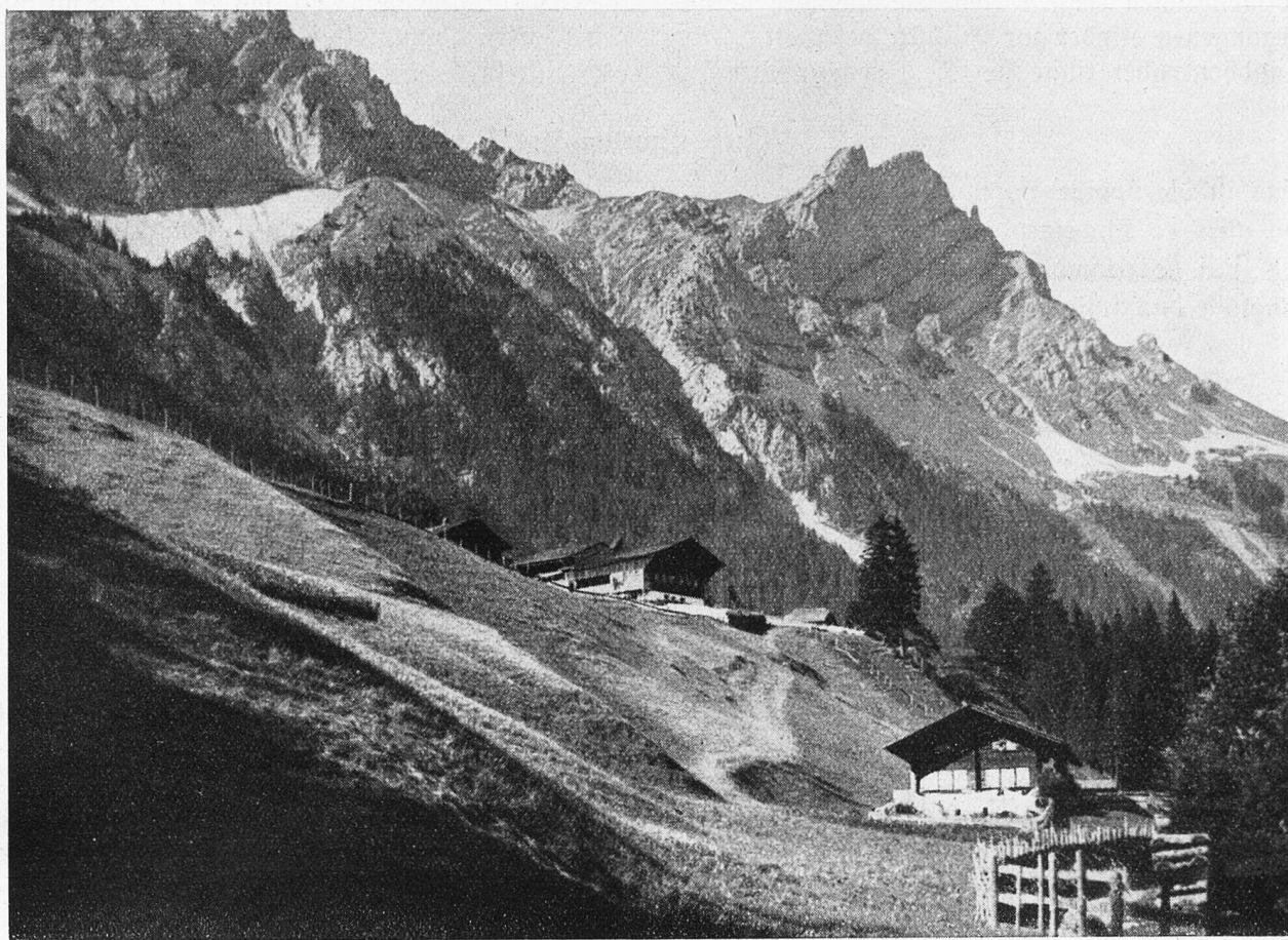
Simmentaler Bauernhäuser im Fernel.