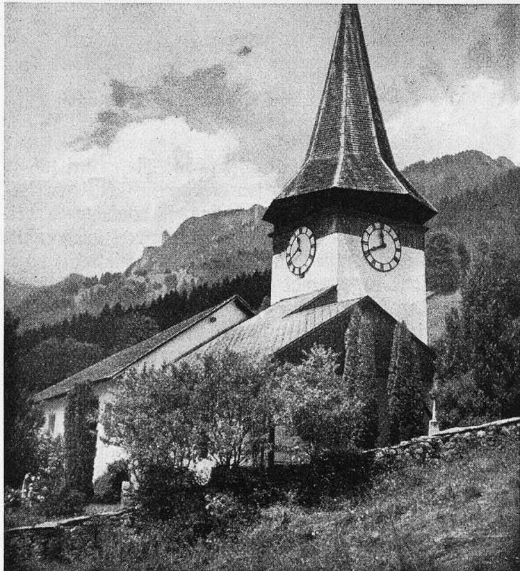
Kirche von Oberwil im Simmental.

In St. Blasien im Schwarzwald fügte es sich, daß sie dem Landvogt von Greifensee, der eine Wirtschafterin suchte, empfohlen wurde, und so diente sie ihm schon seit zwei Jahren. Sie war mindestens 45 Jahre alt und gleich