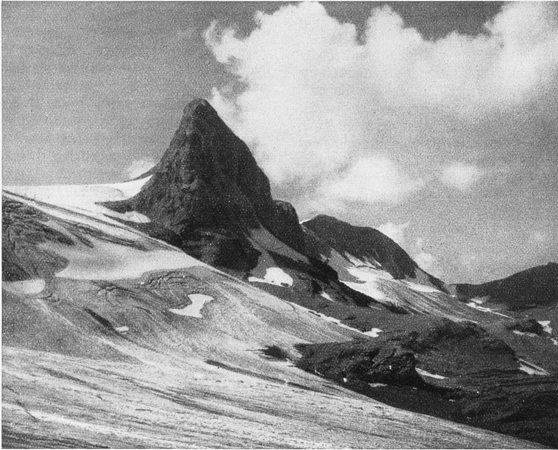
Gletscherhorn und Käsligletscher im Wildstrubelgebiet.