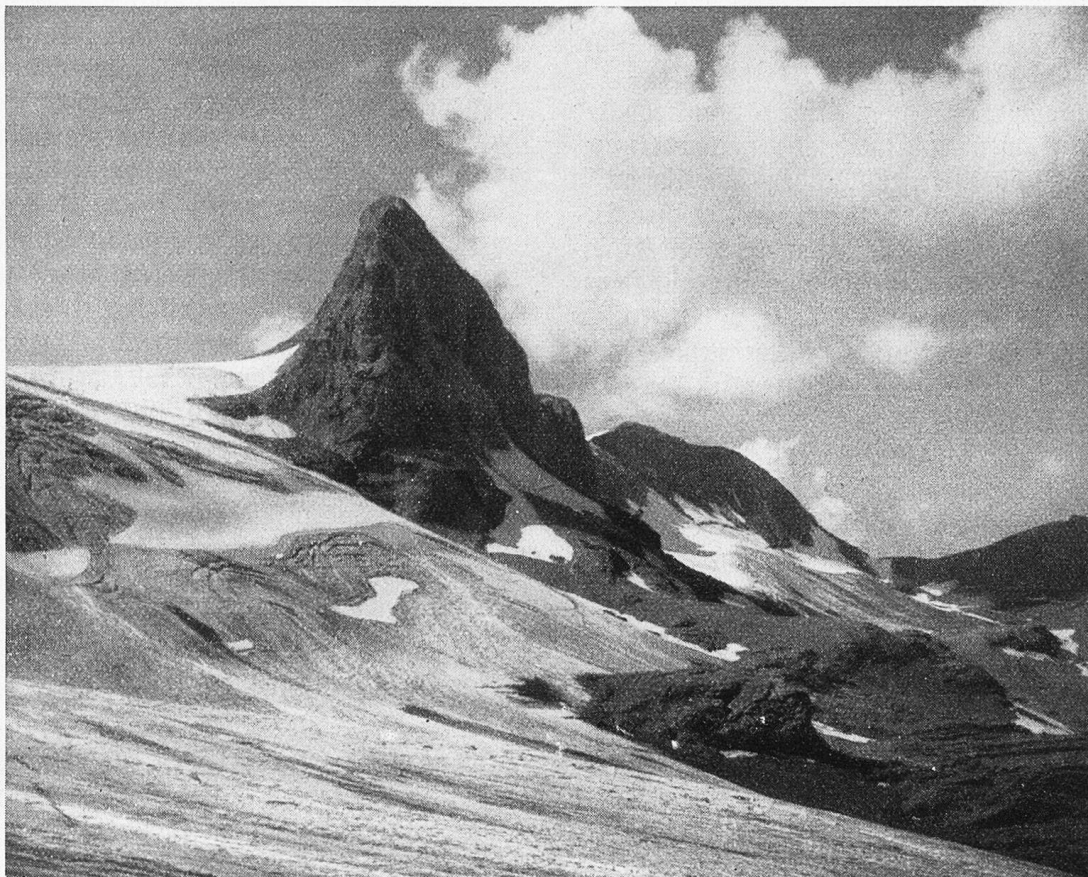
Gletscherhorn und Käsligletscher im Wildstrubelgebiet.