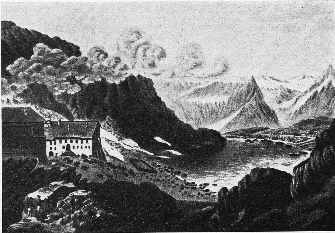
Der Große St. Bernhard. Handcolorierter Stich von J. G. Weibel, 1771—1846.

innere Bindung zur Bergwelt entstand dadurch freilich nicht; niemals suchte sie der Mensch des Altertums zu seinem Vergnügen auf, stets befangen von einer heiligen Scheu vor dem Übernatürlichen, den Geistern und Göttern, die dort