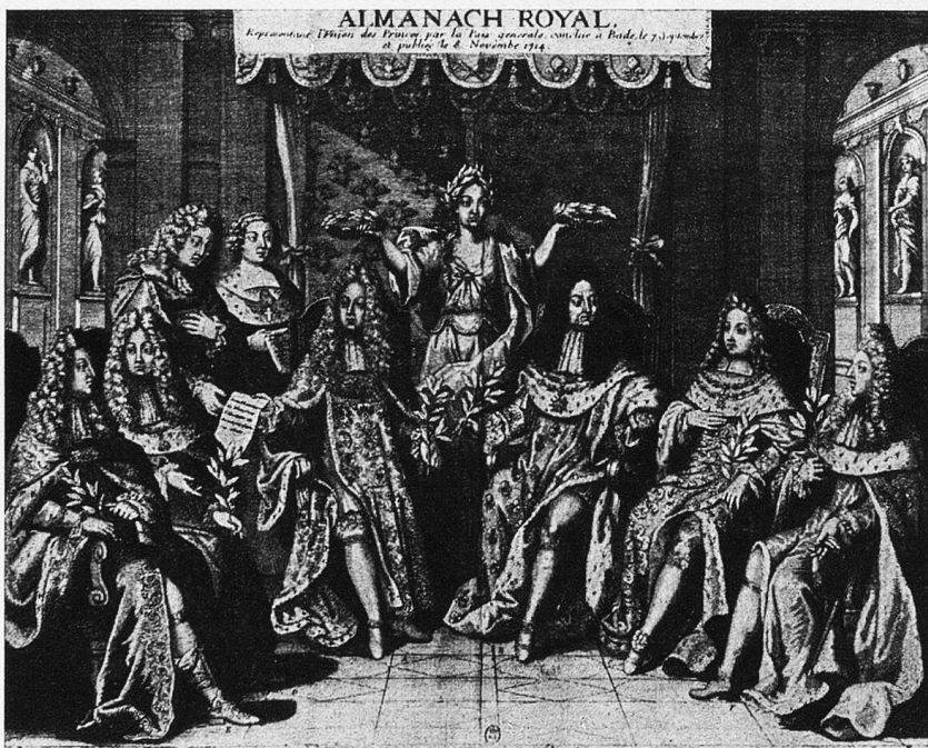
Symbolische Darstellung des Badener Friedens zwischen den regierenden Fürsten Europas.

Mit ganz besonderem Glanz trat der französische Gesandte Graf du Luc in Baden auf. Dieser impulsivste Südfranzose ist eine der interessantesten Persönlichkeiten, die im Ambassadorshof in Solothurn residiert haben. Einem alten Adelsgeschlecht entstammend, hatte er in seiner Jugend ein tapferes Soldatenleben geführt und in der Schlacht bei Kassel mit 24 Jahren einen Arm verloren, worauf er die militärische Laufbahn mit der diplomatischen vertauschte. In einer kritischen Politik war Graf du Luc in Solothurn eine wichtige diplomatische Persönlichkeit; seine spontane, witzige und ironische Art, die Schweizer vom französischen Standpunkt aus zu betrachten, äußert sich mit unbändiger Lebhaftigkeit in seinen Berichten und Briefen. Als Abgesandter des Sonnenkönigs pflegte Graf du Luc in Solothurn mit Prunk und Glanz