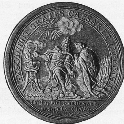
Wiener Friedensmedaille 1714.

kaiserlichen Gesandten in den Schatten zu stellen. Die gnädigen Herren von Bern erwiesen sich dem Gesandten Frankreichs gegenüber besonders höflich, indem sie ihm das „Bernerhaus“ an der Weiten Gasse als Wohnstätte anboten, damit er nicht in einem Gasthaus zu logieren brauchte. Die Tagsatzungsgesandten Berns hatten nämlich regelmäßig in einem stattlichen Gebäude gewohnt, das seit 1678 immer für sie bereitstand und auch heute noch eines der schönsten Wohnhäuser der Badener Altstadt bildet. In diesem behaglichen Wohnhaus wurden Wände entfernt und Ofen abgebrochen, um weiträumige Säle zu gewinnen, die mit allem Glanz der höfischen Raumkunst Frankreichs eingerichtet wurden. Am 30. Mai erschien Graf du Luc mit gewaltigem Gefolge in der Bäderstadt. Er ließ seine Dienerschaft neu uniformieren, brachte sein ganzes Silbergeschirr mit und ließ auch seine französischen Komödianten, Musiker und Tanzkünstler in Baden auftreten. Sein Gefolge umfaßte insgesamt 300 Personen. Dem zweiten französischen Bevollmächtigten hatte Graf du Luc das Städtchen Baden als