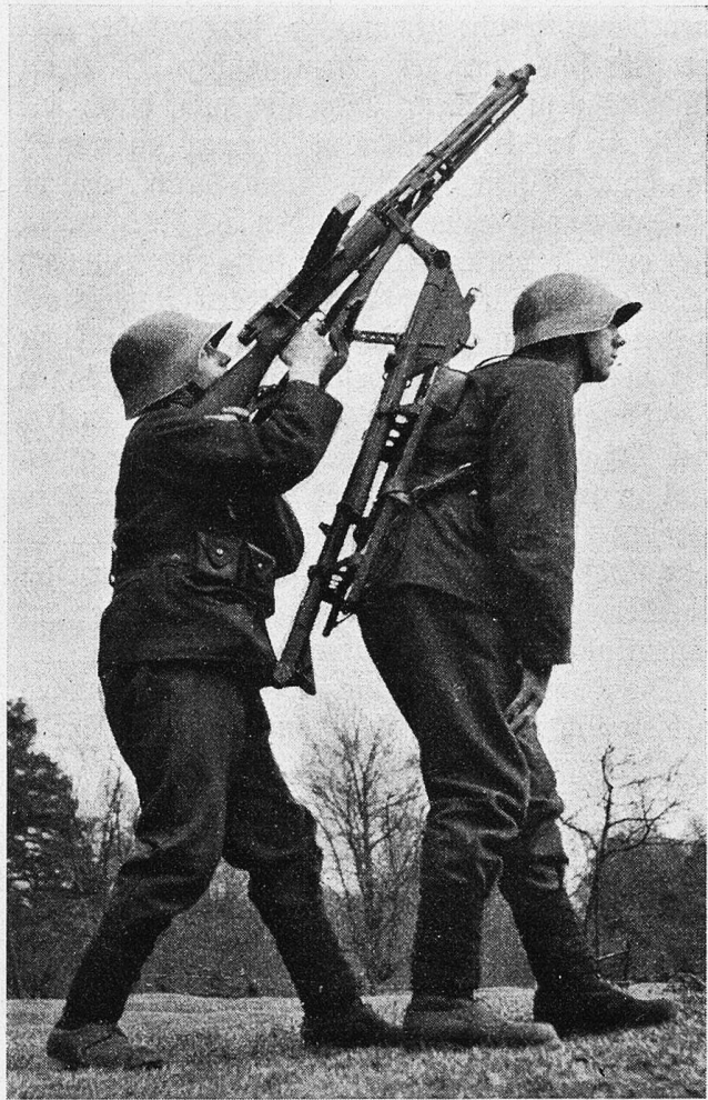
Leichtes Maschinengewehr auf Fliegerlafette montiert.

Wie herrlich mußte es sein, der armen Menschheit solche Dienste zu leisten! Nur zu bald sollte Dunant seine Aufgabe bekommen. Am politischen Himmel gitterte es. Und bald schlug der erste Blitz ein. Henri Dunant zog nach Italien. In Solferino fand er reichlich Gelegenheit, mit seinen hilfreichen Händen zuzugreifen. Er sah Dinge, die neue Pläne in ihm reifen ließen. Was er hier auf dem blutigen Schlachtfeld sah und erlebte,