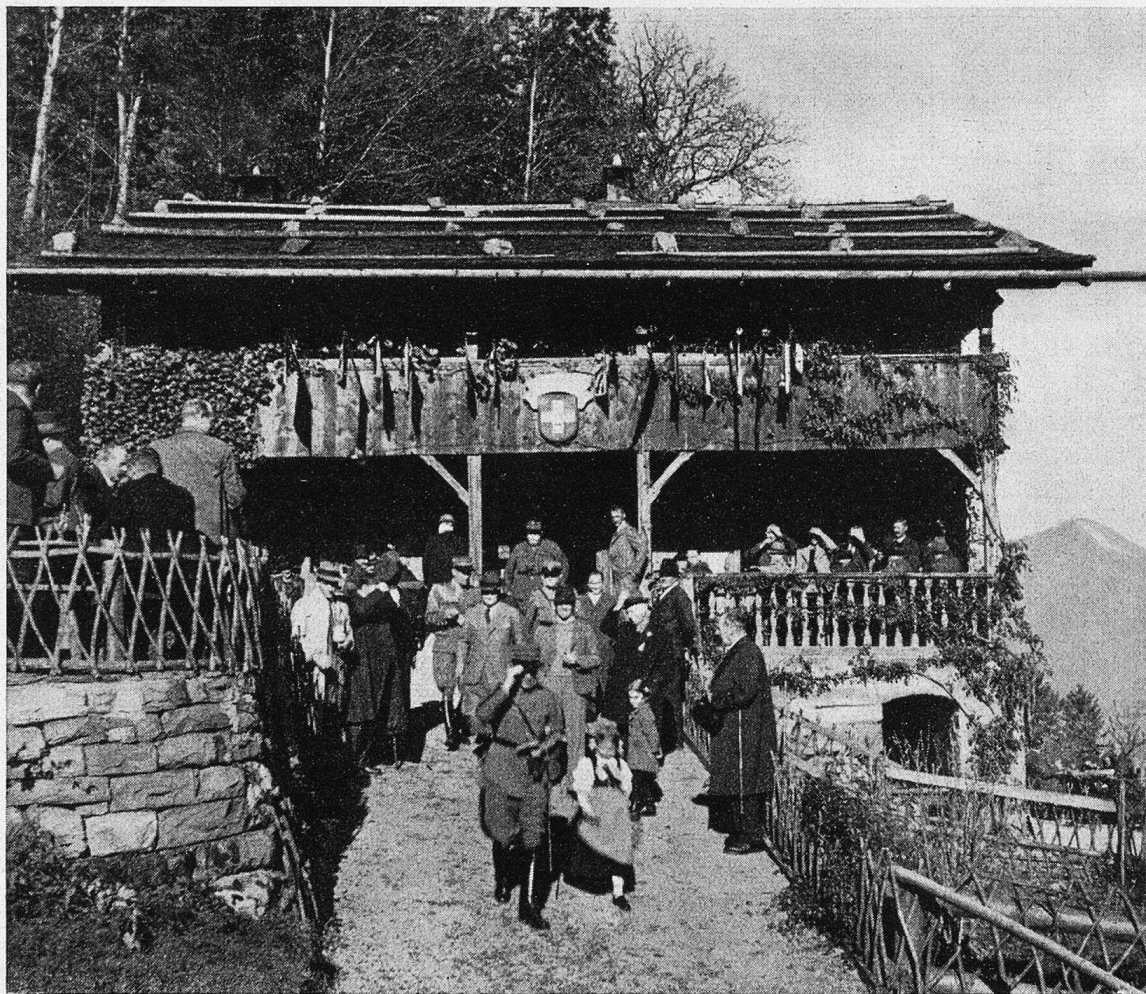
Das Rütlihaus mit der Fahnenburg. Im Vordergrund der General.

Von oben schallt die Kunde: die letzten Schüsse sind gefallen! Bald ist es Zeit zur Landsgemeinde. Den beordneten Meistern bleibt eine kurze Frist, die besten Schützen aus den langen Listen herauszuschälen und die Rangordnung festzustellen. Lorbeerkränze liegen da zur Krö-