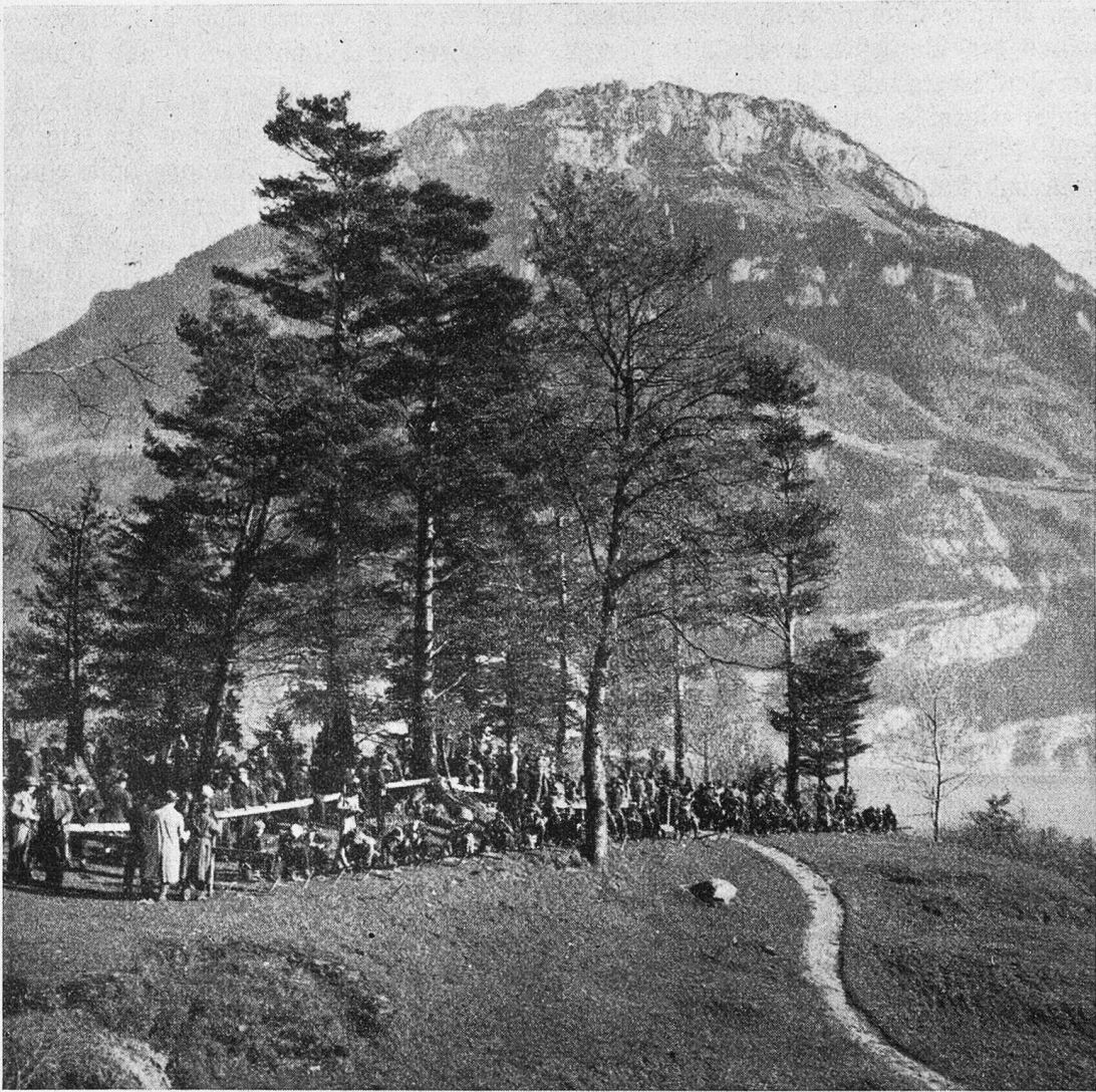
Die Schützen beim Zielen. Im Hintergrund der Frohnalpstock.