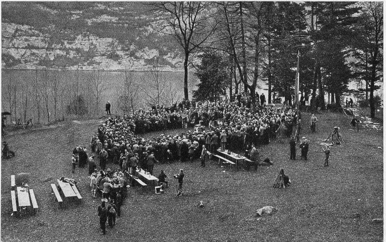
Schützengemeinde auf der Rütliwiese.

Und wirklich, da tritt er über die Schwelle, eine achtungsgebietende Erscheinung in seiner goldumränderten Mütze. Freundliche Lichter spielen in seinem Gesicht. Die fein geschnittenen Züge verraten nicht nur den vorbildlichen Militär. Sie künden einen Menschen, zu dem man gleich Ver-