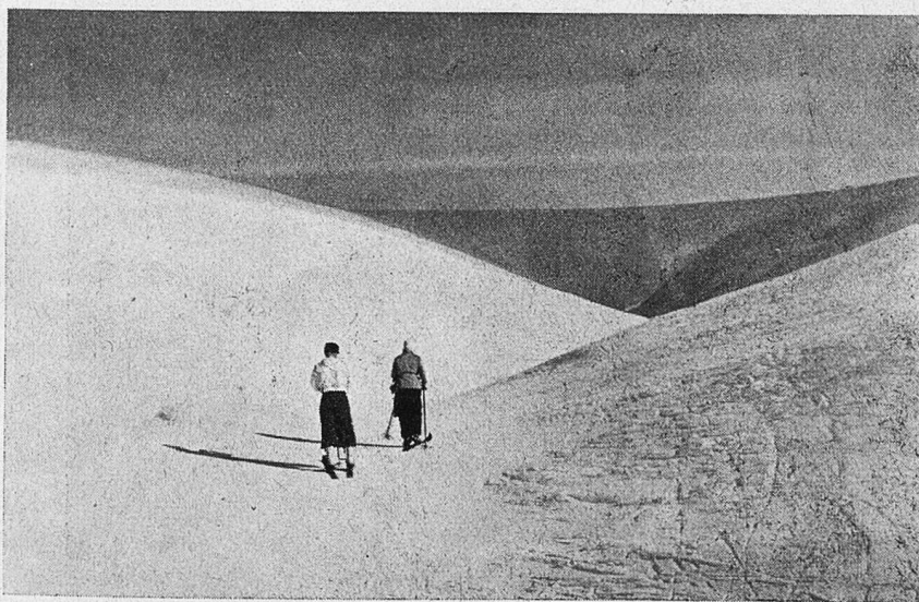
Auf den Bergfluppen des Pallastunturi.

weit fortgeschritten, daß man den Sirius nicht mehr sieht. Aber heller als Dämmerung wird es hier nicht um diese Zeit. Über dem Schnee liegt ein bläuer Hauch ausgebreitet. In der kristallklaren trockenen Luft erheben sich die verschiedenen massiven Berggipfel des Pallastunturi (der höchste ist 821 m hoch) in scharfer, plastischer Weise, und die ganze ungeheure Größe und Weitflächigkeit der Landschaft erleben wir vor unseren Augen. Und eine Einsamkeit und Stille ohnegleichen, voll unendlicher, wohlthuender Schönheit, breitet sich vor uns aus.