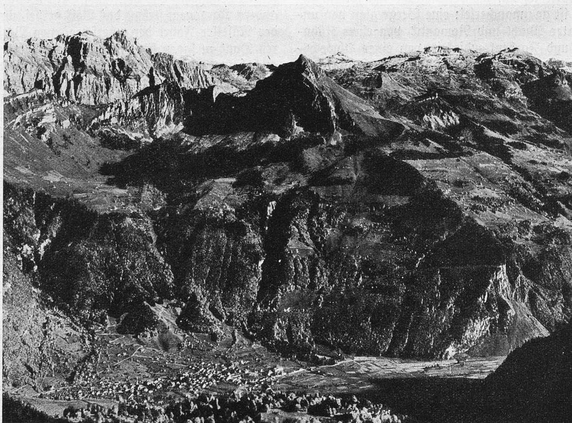
Blick auf Mollis und Frohnalpstock-Gebiet.

Wo das Glarnerländchen ins lange Haupttal