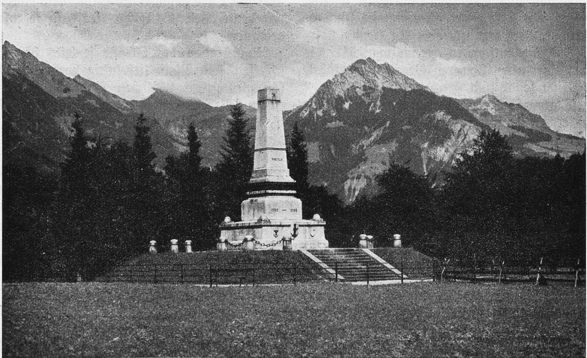
Schlachtendenkmal in Näfels.

So nahm ich sie unter die Füße, die prächtige Strecke zwischen der tiefen Furche des Glarnerlandes und den Steilufeln des Walensees und fand meine Vermutung bestätigt: hier sind Schönheiten ausgebreitet, die man mit Muße genießen soll. Seltsam: etliche Automobilisten begegneten meinem Plan mit Verwunderung. Was kann ein Fußgänger dort oben zu suchen haben? Und heute, nachdem ich die Arbeit hinter mir habe,