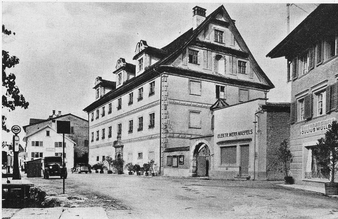
Freulerpalast in Näfels.

antworte ich auf die verfängliche Frage: Zu suchen ist gar mancherlei: eine Bergregion von unerhörter Wucht und Romantik, von einer Kühnheit und Farbenfreudigkeit, von einer Abwechslung, die stets mit neuen Ausblicken zutal und nach den schroffsten Kämmen aufwartet.