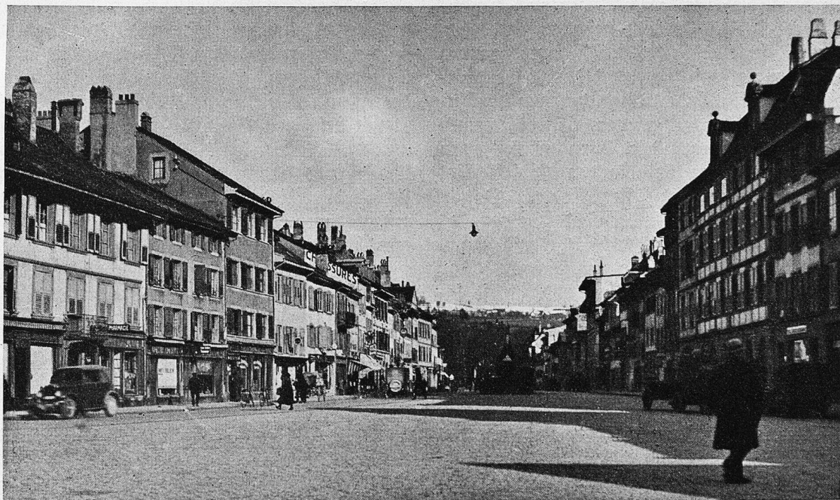
Yverdon: Rue de la Plaine.

In den ersten Jahren beschäftigen sich sogar die Knaben mit einer Puppe; sie gehen ihrer Veranlagung entsprechend bald zu anderen Spielen über, aber die Mädchen beharren treu bei ihren Puppen. Das in ihnen schlummernde Gefühl der Mütterlichkeit erwacht und wächst in der zärtlichen Sorge für die Puppe heran; die Hausfraueneigenschaften beginnen sich in ihnen