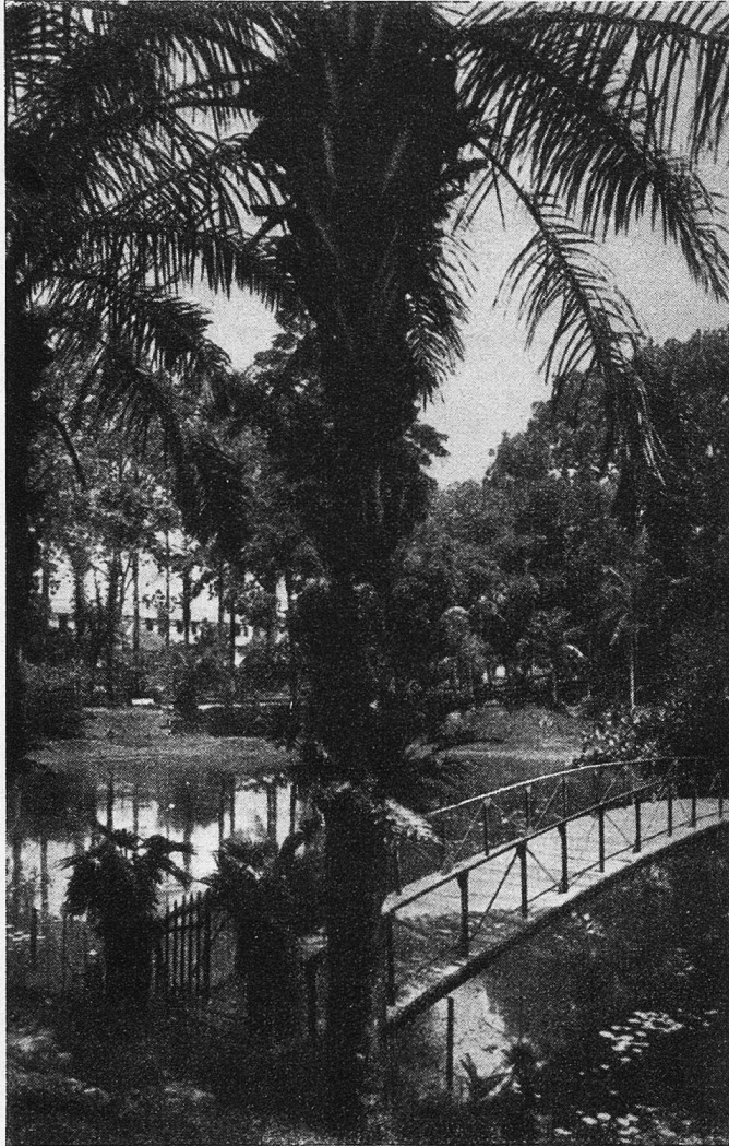
Botanischer Garten in Saigon.

Nähe fließt ein Bächlein, über welches eine zierliche, fast japanische Brücke führt. Eine wunderbare Stille herrscht hier, nur hier und da durch den Ruf oder den Schrei der wilden Tiere unterbrochen.