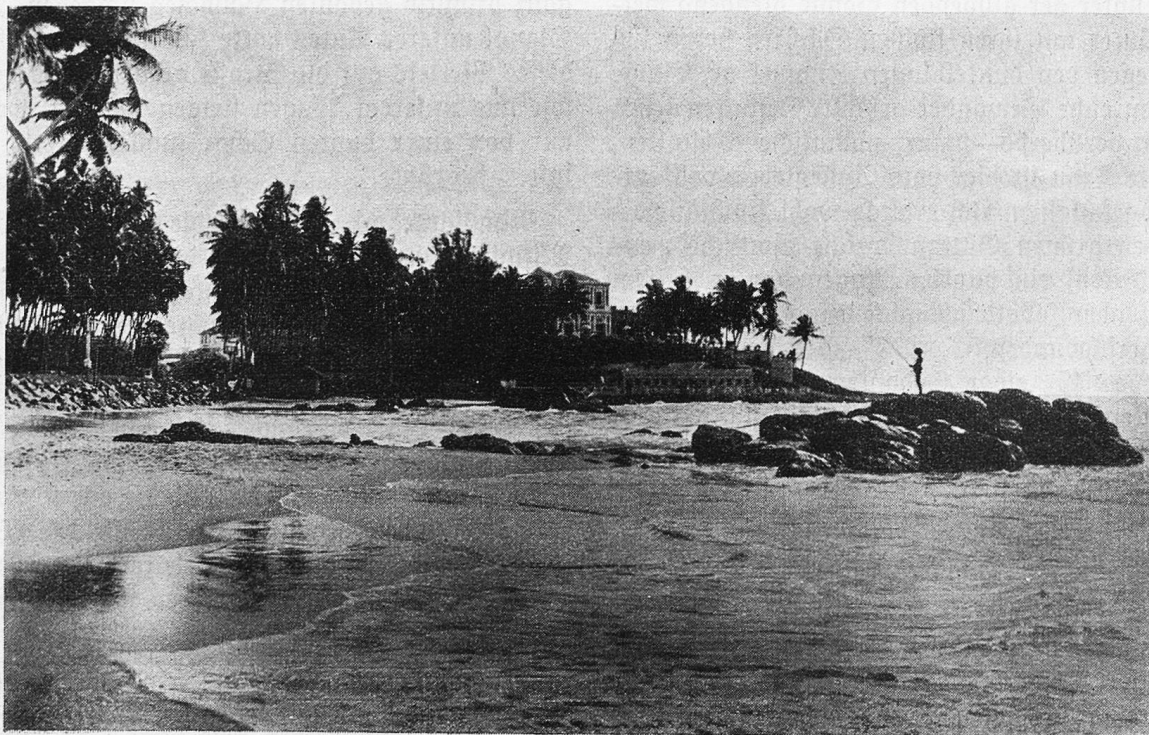
Ceylon. Lavinia-Hotel und Umgebung.

„Mount Lavinia“, ein englisches Hotel, für Touristen gebaut, aber in einer unvergeßlichen Landschaft. Der Golf von Colombo ist hier in seiner großen Ausdehnung sichtbar. Felsen und weißer Sand, der sich kilometerweit am Rand des dunkelblauen Meeres hinreckt. Eine unglaubliche Farbenharmonie rufen die Fischerboote mit ihren roten Segeln auf dem azurblauen Wasser hervor. An der Küste stehen überall uralte, hohe Palmen, vom Wind leise bewegt. Der Himmel, welcher seit dem Roten Meer vom Hizedunst immer weiß und blendend war — ein bedrückendes Gefühl! —, ist hier vom klarsten, schönsten