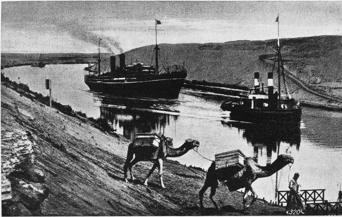
Höchster Durchschnitt der Landenge von Suez bei Ismaïlla (18 Meter).

flüchte eiligst, denn dieses ist nicht die Atmosphäre des Orients, welche ich suche. Ein anderes Port-Said muß ja bestehen, aber unsere Zeit ist bemessen. Es zieht mich dennoch in einige dunkle beschattete Gäßchen, deren Typus viel mehr meinen Wünschen entspricht.