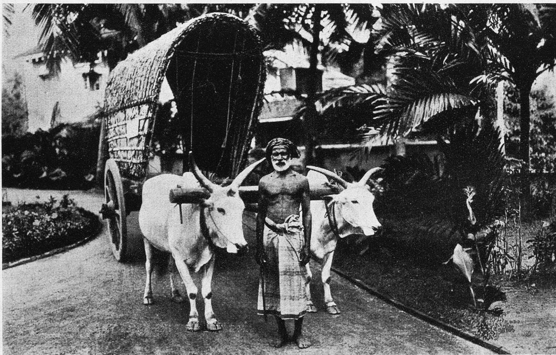
Ochsengepann auf Ceylon.

Mein Blick schweift über die beleuchtete Tanzfläche hinweg, zu den Silhouetten der hohen Palmen, welche sich vom Garten aus wie Schattenbilder gegen die etwas lichtere Himmelsfläche abheben. Es ist eine wunderbar klare Nacht, und die Menge der hier sichtbaren Sterne ist unglaublich! Die Milchstraße erscheint nicht nur als ein nebelartiger Streifen, sie bildet hier ein helles, breites Band.