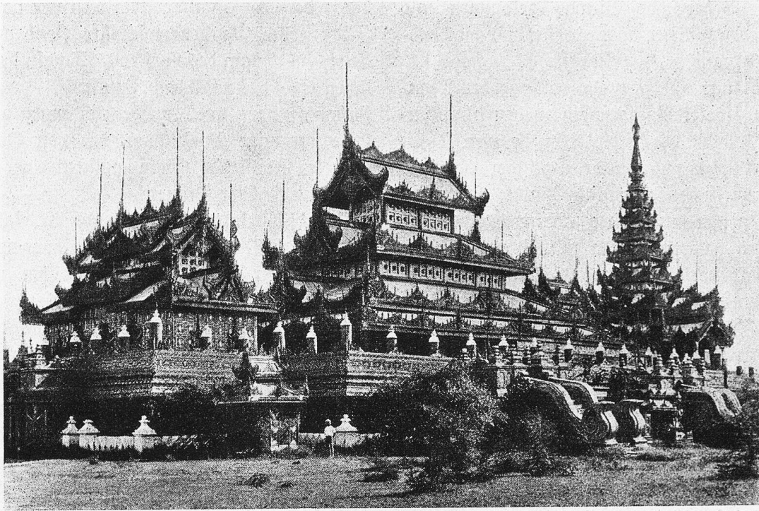
Das goldene Kloster der Könige zu Mandalay, rechts davon der Silbertempel.