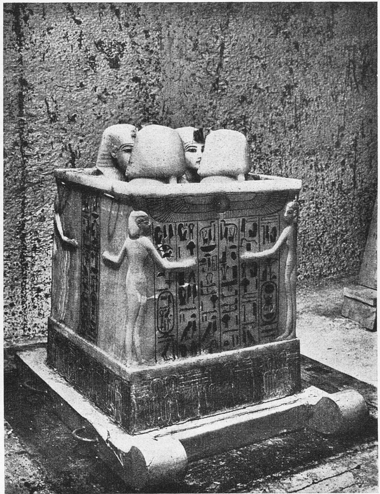
Der Alabasterschrein für die Eingeweide, geöffnet Man sieht auf den Vertiefungen, in denen die Eingeweide bestattet sind, die vier menschenköpfigen Deckel, die das Porträt des Königs zeigen

Etwas gab mir zu denken, und das war die Kleinheit der Öffnung im Vergleich zu den andern Talgräbern. Die Anlage war sicher die der 18. Dynastie. Konnte es das Grab eines Vornehmen sein, der hier mit der Erlaubnis des Königs bestattet war? War es ein Königsversteck, eine verborgene Stelle, wohin eine Mumie mit ihrer Ausrüstung zur Sicherheit gebracht worden war? Oder war es wirklich das Grab des Königs, das zu finden ich so viele Jahre verwandt hatte? Noch einmal untersuchte ich die Siegelabdrücke nach einem Anhaltspunkt, aber an dem bisher freigelegten Teil der Tür waren nur die schon erwähnten Siegel der Königstotenstadt klar zu lesen. Hätte ich gewußt, daß nur einige wenige Zentimeter tiefer ein vollkommen klarer und deut-