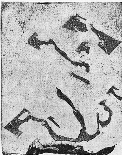
Meteoreisen zur Gruppe Oktaedrite gehörend: gefunden 1884 im Glorieta Mountain Neu Mexiko, USA.

ment zur Erde niedersauste. Die oft recht auffälligen schild- und keulenförmigen Massen bestanden überdies aus einem Erz, dem Eisen, das den Menschen noch lange bis in die geschichtliche Zeit hinein vollkommen fremd war. In prähistorischen Gräbern wurden Meteorisen gefunden, sowohl in Kupfer gefaßt, zum Schmucke dienend, als auch unbearbeitet. Ein Eisen von schildförmiger Form, das in Rom unter Numa Pompilius niedergefallen sein soll, fand einst göttliche Verehrung, bis auf den heutigen Tag noch der heilige Stein in der Kaaba zu Mekka. Sagenumwoben ist der im Rathaus zu Elbogen seit Jahrhunderten aufbewahrte „verwunschene Burggraf“, ein Meteorisen, das um 1400 bei Elbogen (Böhmen) ge-