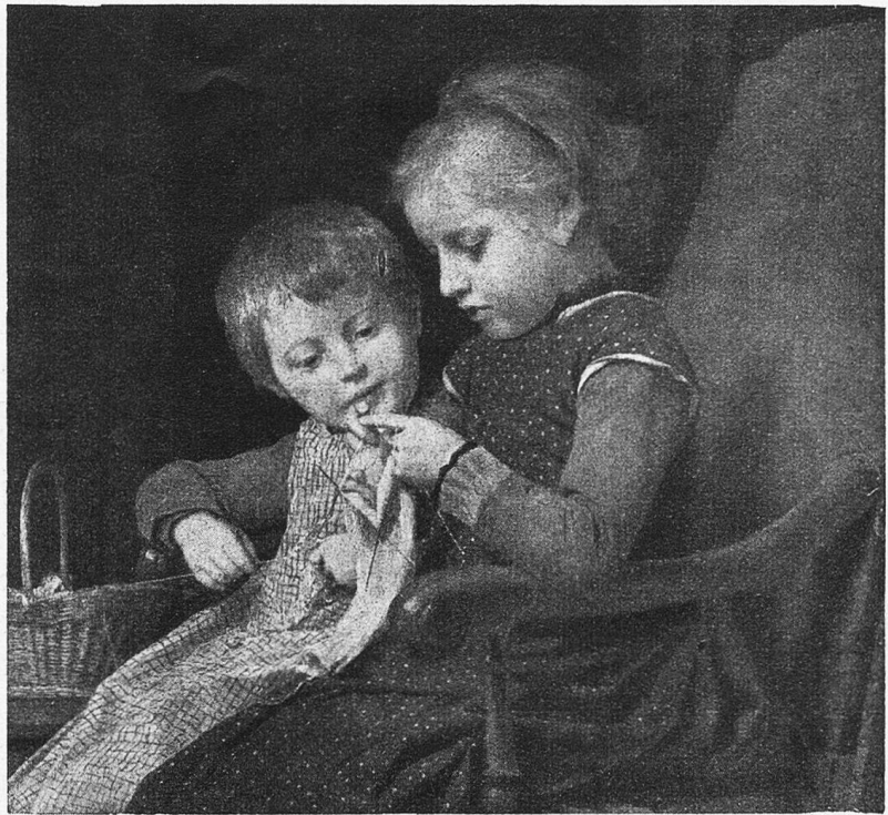
Albert Anker: Die kleinen Schwestern

Unter den Bildern alter Leute ragt auch das 1885 entstandene Gemälde „Hohes Alter“ hervor. Es stellt eine alte Frau dar, welche die ausgestreckten Hände am Feuer wärmt und dabei sinnend vor sich hinblickt. Mit behutsamer, liebevoller Beobachtung hat Albert Anker hier das Nachdenkliche, Versonnene des Alters dargestellt. Die Erinnerung an manche Sorge prägt sich in dem charaktervollen Gesicht der alten Bauernfrau aus, und so darf man dieses Bild zu den Werken Ankers zählen, die ein menschlich bedeutungsvolles Thema mit sinnbildlicher Kraft gestalten. Als Anker selbst ein alter Mann wurde, war sein Wesen nicht mehr allen Aufregungen des bewegten Lebens gewachsen. Solche Aufregungen häuften sich um den Siebzigjährigen, als seine