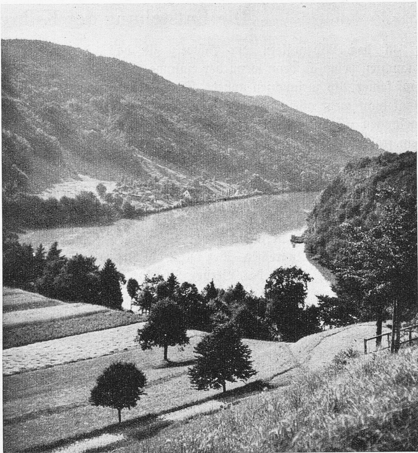
Nr. 6151 BRB 3. 10. 39 Tölegg. Mündung in den Rhein