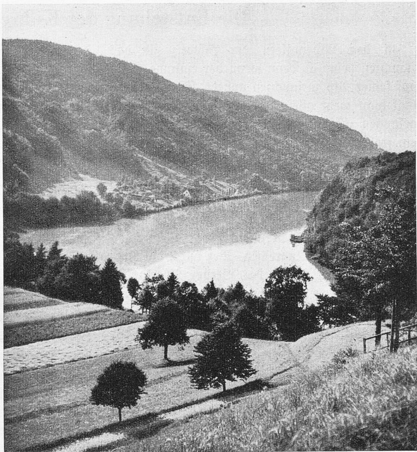
Nr. 6151 BRB 3. 10. 39 Tölegg. Mündung in den Rhein