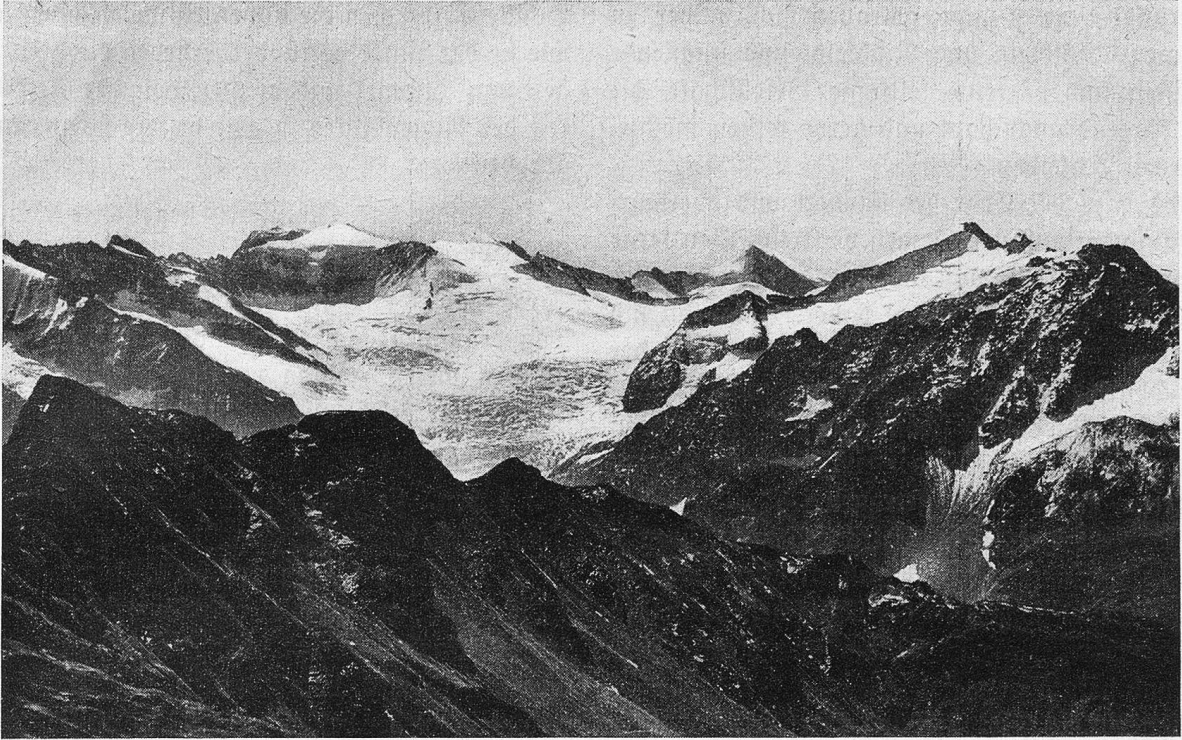
Melchseefrutt. Ausblick vom Hohenstollen auf Triftgletscher.