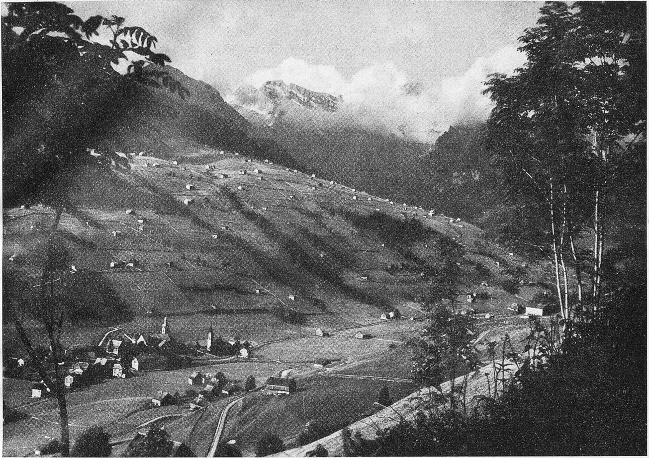
Alt-St. Johann im obern Toggenburg