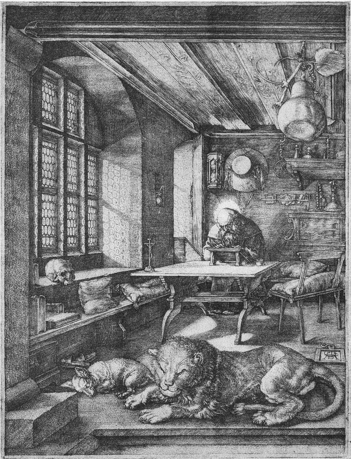
Kupferstich von Alb. Dürer