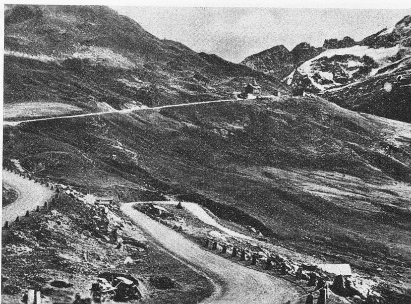
Eine der letzten Kehren, die zur Paßhöhe auf der Urnerseite führt

Ist so etwas überhaupt noch modern, kann man sich fragen, wo doch mit der Freigabe des Benzins der Autoverkehr bei fanatischer Begeisterung dermaßen eingesezt hat, daß sonntags das ganze, liebe Schweizerland über alle fahrbaren Pässe und in alle Winkel abgerast wird? Doch selbst der Autoverkehr scheint mir heute nicht mehr das Modernste zu sein, nachdem die Entfernung von Land zu Land, von Kontinent zu Kontinent verkürzt und die Welt scheinbar für die Menschen kleiner geworden ist. — Und trotz alledem der Klausenpaß einmal zu Fuß mit bedächtigem Schritt wie in der guten alten Zeit, dies dürfte für jeden, dem das Herz am rechten Ort schlägt, eine recht vergnügliche Wanderung bedeuten, wo er seine patriotischen Knabenträume wieder aufleben lassen könnte. — Dieser Schweizeralpenpaß bietet eigene und schönste Naturwunder. Aus Gründen der Hebung wirtschaftlicher und militärischer Kraft wurde die Klausenstraße über den 1952 m hohen Paß um die Jahrhundertwende erbaut zur Verbindung der Zentral- mit der Ostschweiz. Es gibt in den gesamten Alpen keine zweite Bergstraße, die auf verhältnismäßig kurzer Entfernung von bloß 25 Kilometern Tieftal mit Tieftal verbindet und zugleich in die Region der Gletscherwelt hinaufdringt. Von Altdorf aus, wo auf dem Hauptplatz vor dem Turm das Tellendenkmal steht,