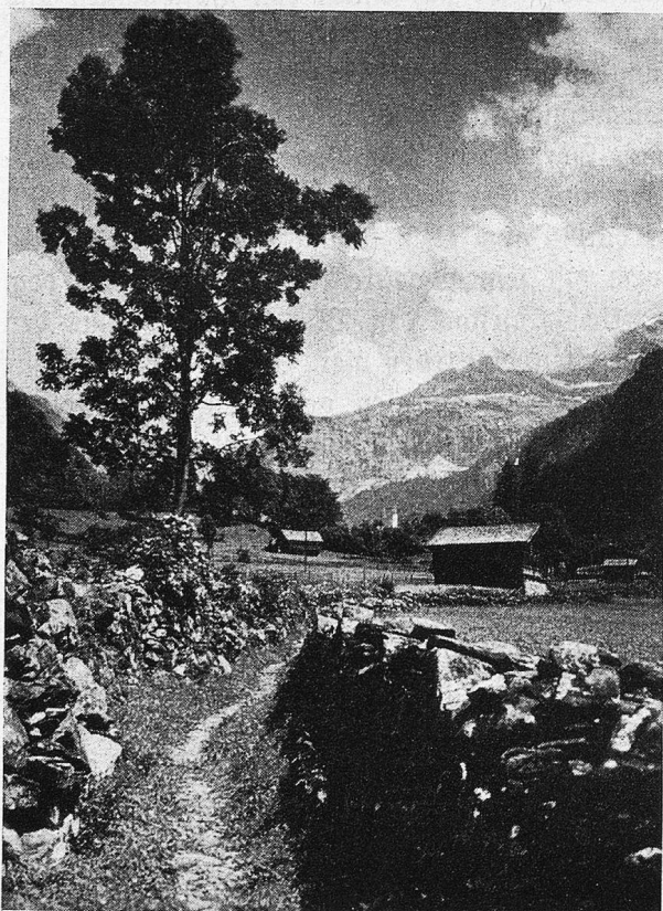
Am Wege nach im Unterschächen

Schon ist Urigen erreicht. Auf einem eigent-lichen Plateau stehend, genießt der Beschauer hier einen selten schönen Rundblick zum Brunni-tal hinüber und zu den schartigen Wänden der großen Windgälle hinauf. Ein kleiner Fußweg führt von hier zur nahgelegenen Alpenkapelle von Getschweiler, die in ihrem Altargemälde ein kostbares Kleinod bietet, eine Pietà, die einst ein Urner Condottiere durch einen berühm-ten Maler aus der Bologneserschule, genannt Fiamingo, malen ließ und der Kapelle stiftete. So zog auch die Kunst in diese Höhen der Na-turschönheit. Und wem Lust ankommt, sich an den Pforten des kleinen Kirchleins auszuruhen, um dabei die Geschichte des Suworowschen Al-penüberganges zu studieren, der nehme den nö-tigen Lesestoff und die Karte mit. Von Spirin-gen aus mußte das Russenheer, vom Gotthard kommend, schon übel mitgenommen, wieder an-steigen zum 2076 m hohen Kinzigkulum und auf Schlitten und Schleifen die Kanonen mitschlep-pen, zum Übergang ins Muottatal, neuen Kämpfen und neuen Pässen zu, weil kein Durch-