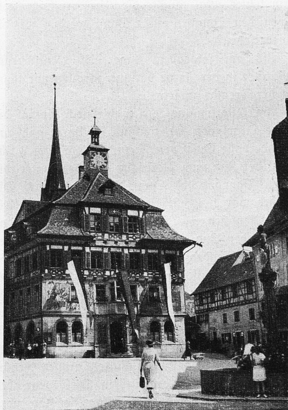
Das alte prächtige Rathaus mit künstlerisch wertvollen Fresken von Prof. Häberlin geschmückt

In der Stadt Stein und deren Umgebung hatten zuerst die Römer, dann die Herzoge von Schwaben, insbesondere aber die Herren von Klingen, die Abtei St. Georgen und andere Klö-