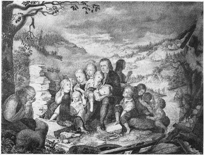
Pestalozzi auf den Trümmern zu Stans

Wir ehren in ihm den Pädagogen, der allen Unterricht an den Gang der Natur gebunden, der der Schule die Pflicht erziehender Menschenbildungen in die Erinnerung zurückgerufen und das Narrenholz aus ihr verbannt hat, der ihr die Aufgabe stellte, fürs Leben zu bilden und nicht für totes Wissen, der sie zum Organ allgemeiner Menschenbildung ohne Unterschied der Stände gemacht, und der, wie er dadurch der