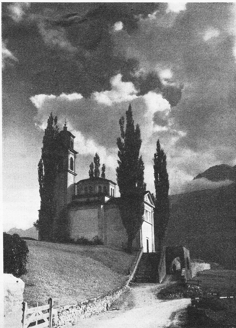
Sta Maria, Poschiavo.

drucksgewaltig: im unteren Buschlag der blaue See von Le Prese, Wiesen und Gärten — hier oben die gewaltigsten Berggipfel mit ewigem Schnee! Wer diese Kontraste einmal selber miterlebt hat in so raschem, ja verblüffendem Wechsel, vergißt sein Leben lang nicht die wundervolle Fahrt über den Bernina.