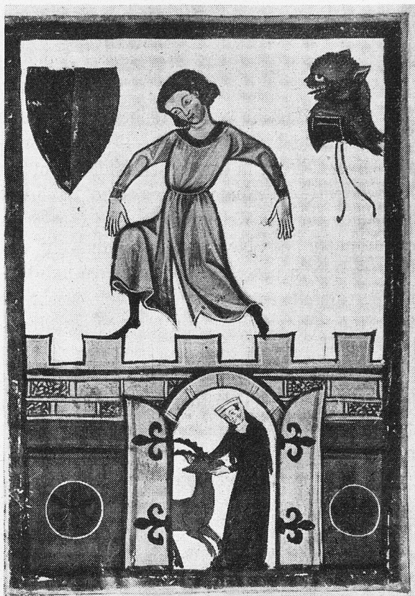
Heinrich von Sax (Wappenbild)

Ob schon auch die Herren zu Misox oder Mosax zeitweise hohes Ansehen genossen und sogar in den Grafenstand erhoben wurden, waren sie schon 1480 genötigt, ihre Herrschaft an den Mailänder Tribulzio zu veräußern. Nun ging es mit