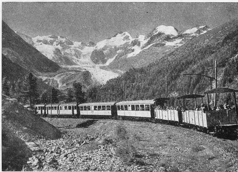
Von ferne leuchtet die Bernina

Ich vermeide die Straße und steige den Hang empor in der Richtung, wo das Hospiz zu vermuten ist. Kaum 80 Meter habe ich zu überwinden. Der massive Bau macht einen merkwürdig vernachlässigten Eindruck, scheint außerdem un-