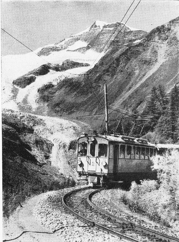
Steil führt die Bahn an den weissen Riesen heran

bewohnt zu sein. Jegliches Leben fehlt indessen nicht. Ein gräuliches Vögelein betreibt oben auf dem Dachfirst den Insektenfang und stellt derweilen ab und zu das rostrote Steuer zur Schau. Auch durch seine kunstlose, aber doch irgendwie heimelige Strophe verrät sich das Hausrotschwänzchen mit Sicherheit. Es beweist, daß seine ursprüngliche Heimat die Berge sind, obschon es allerwärts im Tal beobachtet werden kann, gerade auch in den lärmerfüllten Städten. Es erweist sich darob als echter Kulturfolger, wie noch manche andere gefiederte Kreatur ebenfalls.