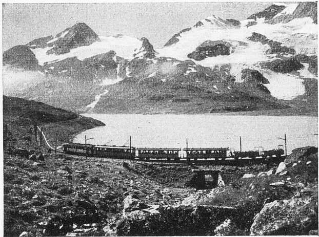
Am Lago Bianco

Trotz des magern Bodens finden da mancherlei Vertreter der alpinen Flora ein Fortkommen. Nach ein paar rötlich-violetten Alpenastern ( Aster alpinus Linn.) hüde ich mich gern, sie haben meinen besondern Gefallen und erhalten ebenfalls ein Plätzchen hinterm Hutband. Un-