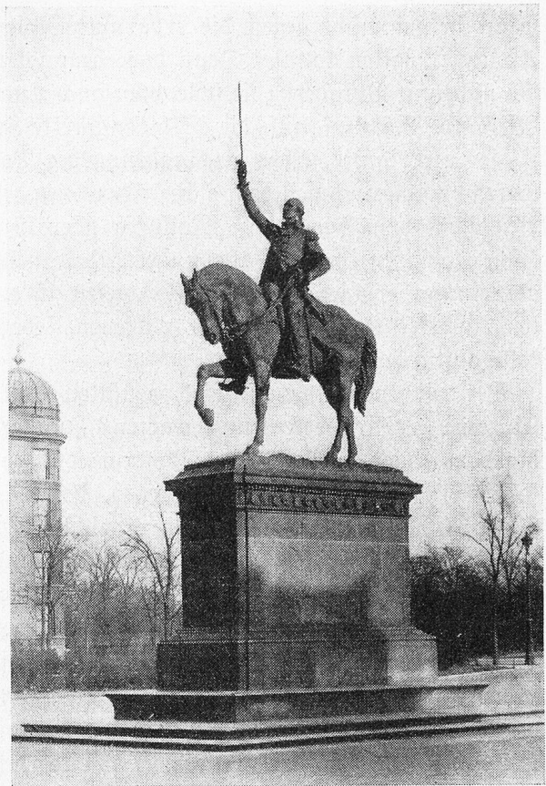
Das Denkmal des grossen Feldhern in Chicago