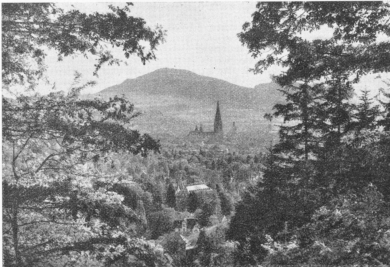
Ansicht von Freiburg im Breisgau