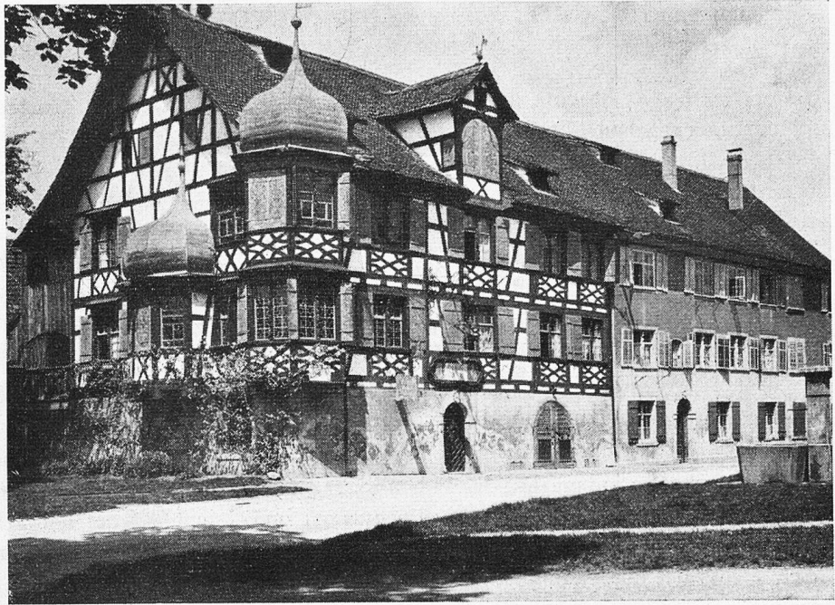
Die Drachenburg in Gottlieben, eines der schönsten Riegelhäuser in der Schweiz, erbaut 1617.

Auch wird erzählt, dass ein Bauer, welcher einst daselbst in Schlummer verfiel, sich plötzlich in die versunkene Burg hinunter entrückt sah. In einem grossen Gemache sassen der Ritter und seine Genossen auf glühenden, eisernen Stühlen um einen runden Tisch, welcher mit Speisen und Getränken mancherlei Art besetzt war. Vom quälendsten Hunger bis auf Haut und Knochen abgemagert, waren sie gezwungen, die siedendheissen Speisen und Getränke zu verschlingen und brüllend ob dem höllischen Spuke, der dadurch in ihren Gedärmen verursacht wurde, wälzten sie sich dann auf dem Boden herum, als gerechte Strafe für die einst in frevler Lust verübten Missetaten. Die Uhr aber wies noch immer die erste Stunde des Festtages. Neben an in einem schön geschmückten Saale sassen an einer vollbesetzten Tafel diejenigen Armen, welche einst von dem gefühllosen Ritter und seinen Gesellen mit Spott und Hohn vom Schloss getrieben worden waren, und in das Schmerzgestöhne der Nachbarn mischten sich ihre Freudenstimmen.