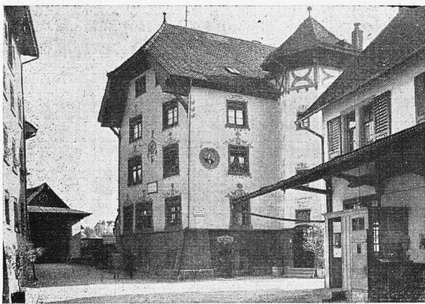
Das Scheffelhaus zu Säckingen, in welchem der Dichter wiederholt wohnte.

Der junge Dichter war katholisch erzogen worden und blieb dem Bekenntnis seiner Eltern treu, zeichnete sich aber durch jene Grosszügigkeit und Toleranz in Glaubenssachen aus, die bei den Alemannen diesseits und jenseits des Rheines üblich (und dem Andersgläubigen gegenüber unvoreingenommen) ist. Als im Jahre 1848 die Wogen der Revolution über Deutschland rauschten, um aus dem verknöcherten Bund deutscher Fürsten ein modernes Reich zu schaffen, wurde auch der junge und begeisterungsfähige Scheffel mitgerissen, wandte sich aber bald und enttäuscht von unfruchtbaren Debatten mittelmässiger Politiker wieder seinen Studien zu, die er (Ende des folgenden Jahres) dann mit Auszeichnung abschloss. Vorher hatte er indessen noch eine Reise durch die Schweiz, über den Gotthard bis an den Comersee gemacht, um in der Natur Heilung für die Missstimmung seiner Seele zu suchen.