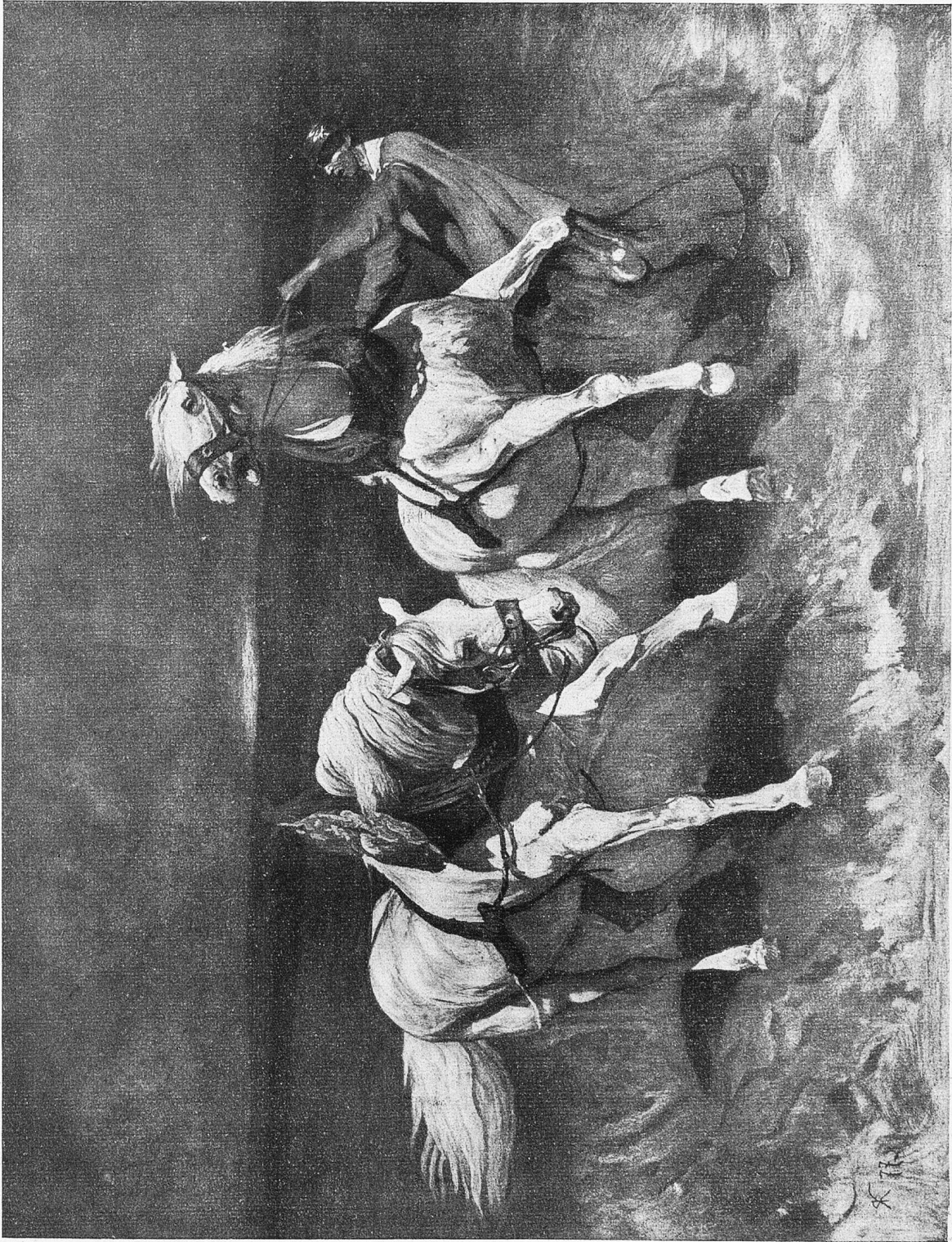
Schimmelgespann. Gemälde von Rud. Koller.