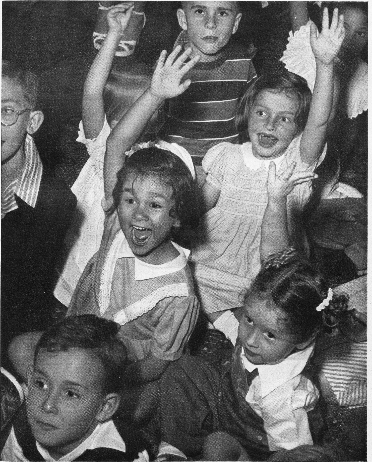
Fünf Schweizerkinder in Caracas (Venezuela)