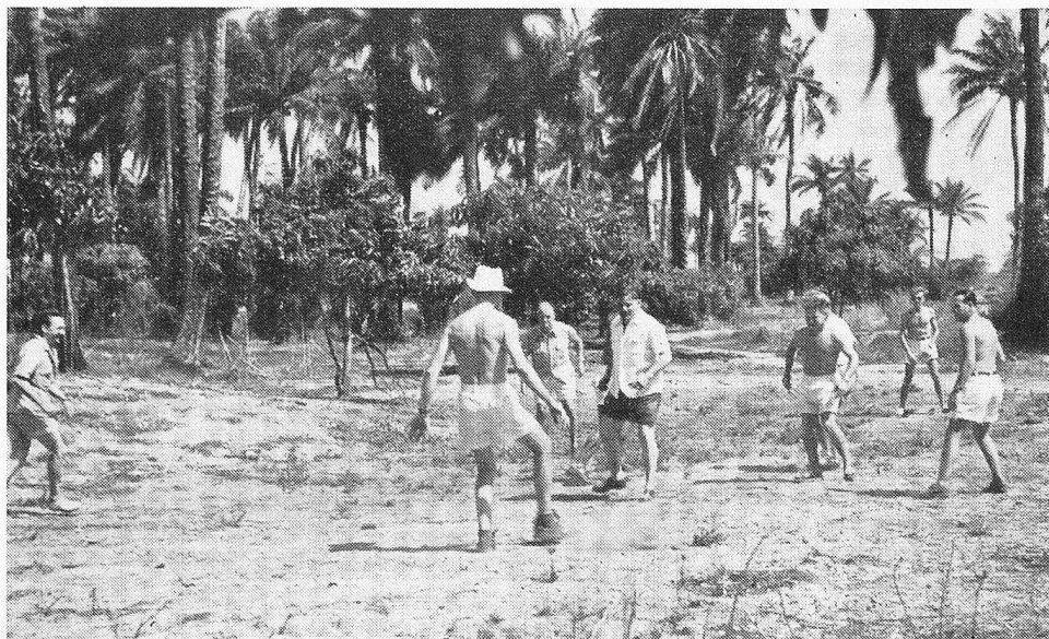
Ein Fussballmatch im Urwald

kämpfen, da die Rückwanderer aus Indonesien in Scharen eintreffen und den Arbeitsmarkt stark konkurrenzieren. In Deutschland und Oesterreich hat sich die Lage indessen in jüngster Zeit neuerdings gefestigt, da die Arbeitsmöglichkeiten wesentlich besser geworden sind. In den skandinavischen Ländern sind die Schweizer Zuwanderer zahlreicher geworden, haben jedoch dort wenig Aussichten auf einen dauernden Aufenthalt. Von den Landsleuten hinter dem eisernen Vorhang weiss man leider nicht viel. Teils sind die Kolonien aufgehoben worden, teils unterhält man noch geringe Beziehungen zu ihnen, soweit als die Umstände es gestatten, denn es ist für die Schweizer in diesen Ländern meist gefährlich, mit der Heimat einen regen Briefwechsel zu unterhalten.