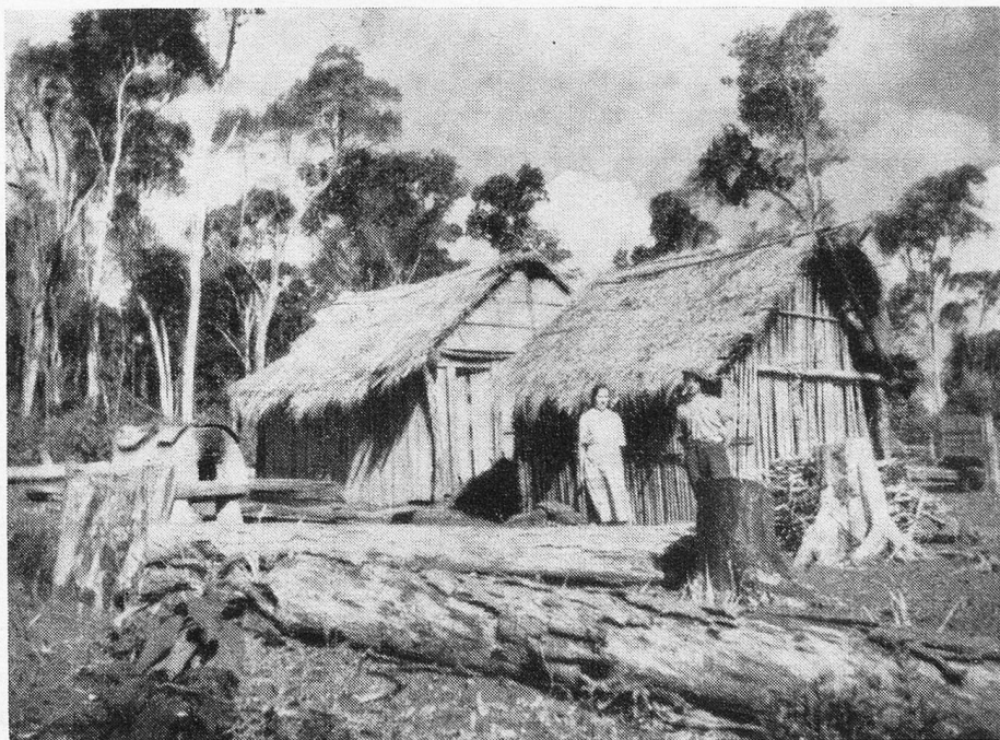
Eine Schweizerfarm im Urwald

Die überseeischen Länder erfreuen sich dagegen grosser Beliebtheit bei unseren Auswanderungslustigen, während die europäischen Nationen als dauernde neue Heimat für die Schweizer seltener mehr in Frage kommen. In Südamerika ist, Argentinien ausgenommen, in allen Staaten eine Zunahme der Schweizerkolonien festzustellen. Desgleichen in den angelsächsischen Ländern: Australien, Kanada, USA und Südafrika. Dünner geworden sind die Kolonien dagegen in Nordafrika, und ganz wesentlich gelichtet haben sich die Reihen der Schweizer in Deutschland und Frankreich. In Holland und England konnten sie sich überraschend gut halten, haben aber in den Niederlanden mit grossen Schwierigkeiten zu