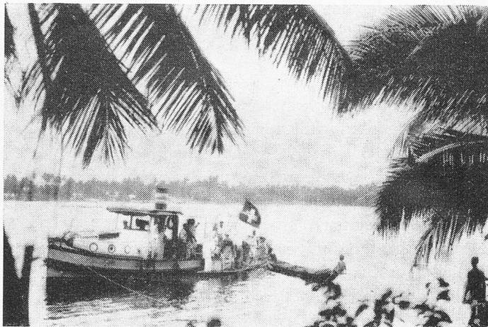
Die Schweizerflagge auf dem Urwaldstrom (Nigeria)

«Swiss Journal», 4000 Stück Auflage und Wellington (Neuseeland): «Helvetia» mit der kleinsten Auflage von 250 Stück. Daneben beziehen unsere Landsleute die Zeitschrift der Schweizer im Ausland, das in Bern redigierte «Echo» mit einer Auflage von immerhin 15 000 Stück.