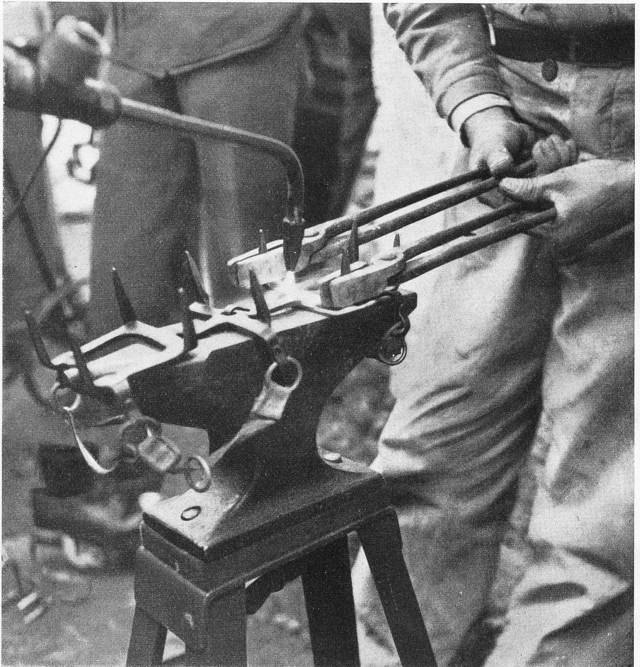
Die Steigeisen müssen mit Zange und Schweißbrenner genau dem Schuh angepasst werden, damit man sich im Eis auf sie verlassen kann.

ihm zugewiesenen Platz so bequem wie möglich einzurichten. Es wurde Nacht über dem üblichen Retablieren und den ebenso üblichen Anfangsschwierigkeiten.