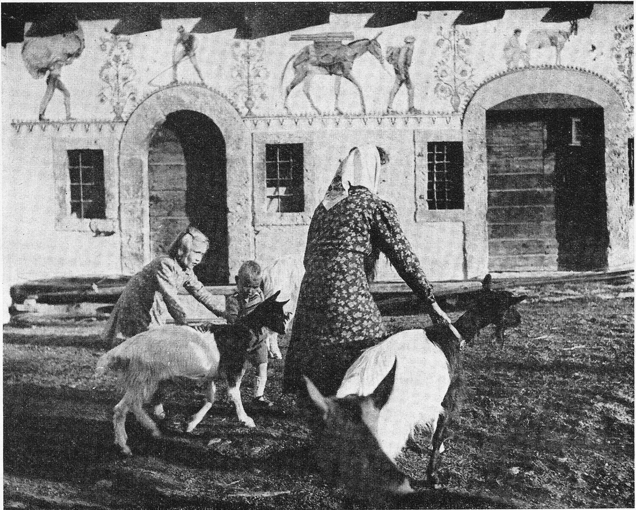
Ernen im Goms. Das Dorf der Ziegen

Inzwischen blieben aber die Leute von Ernen nicht untätig. Sie sahen sich nach neuen Ländern um und sind in Scharen nach Argentinien, später auch nach Nordamerika ausgewandert. Ein Jost aus Ernen brachte es bis zum Rang eines argentinischen Senators und soll sein schmuckes Dörfchen trotzdem nie vergessen haben. Paul Hächler