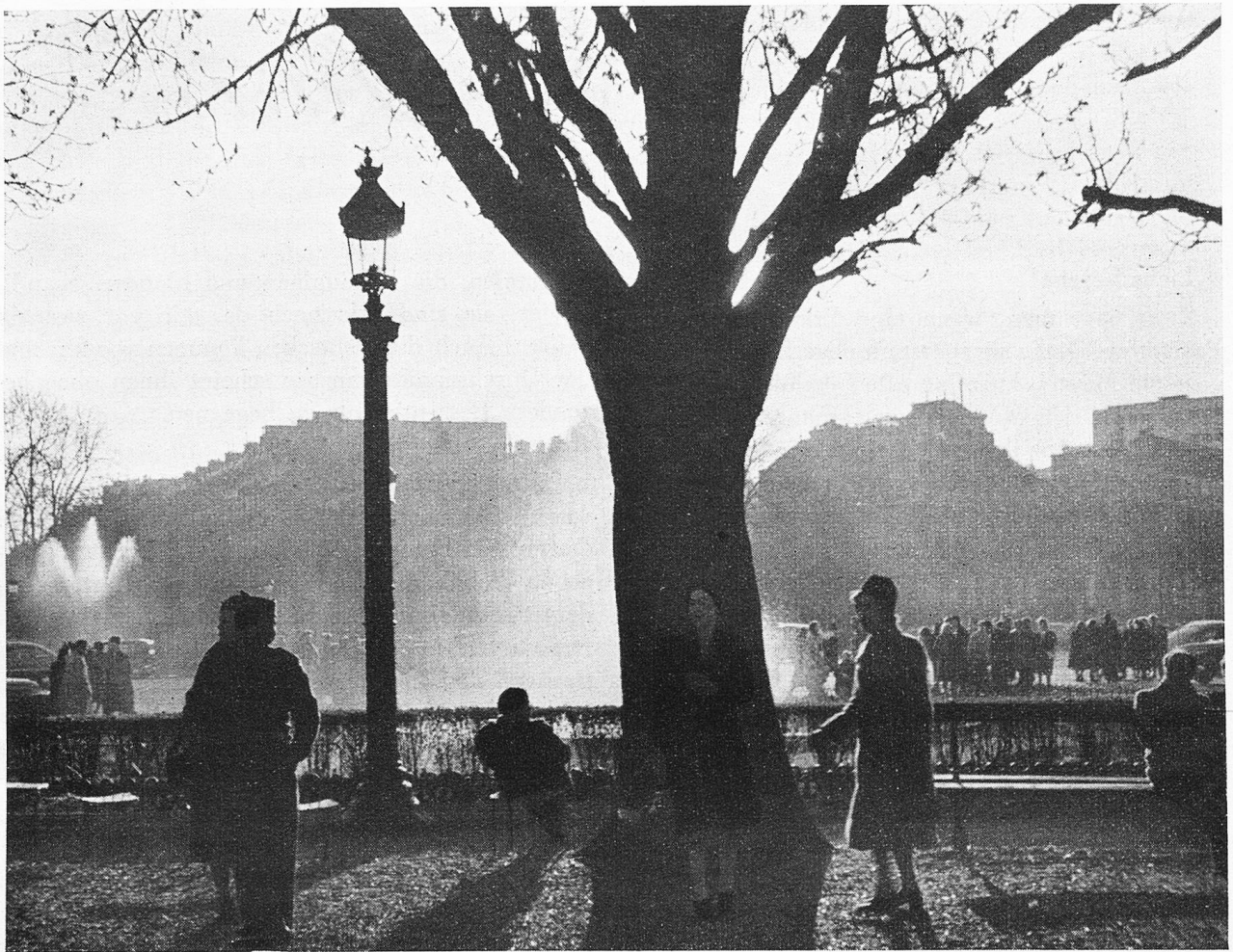
Inseln der Ruhe in Paris