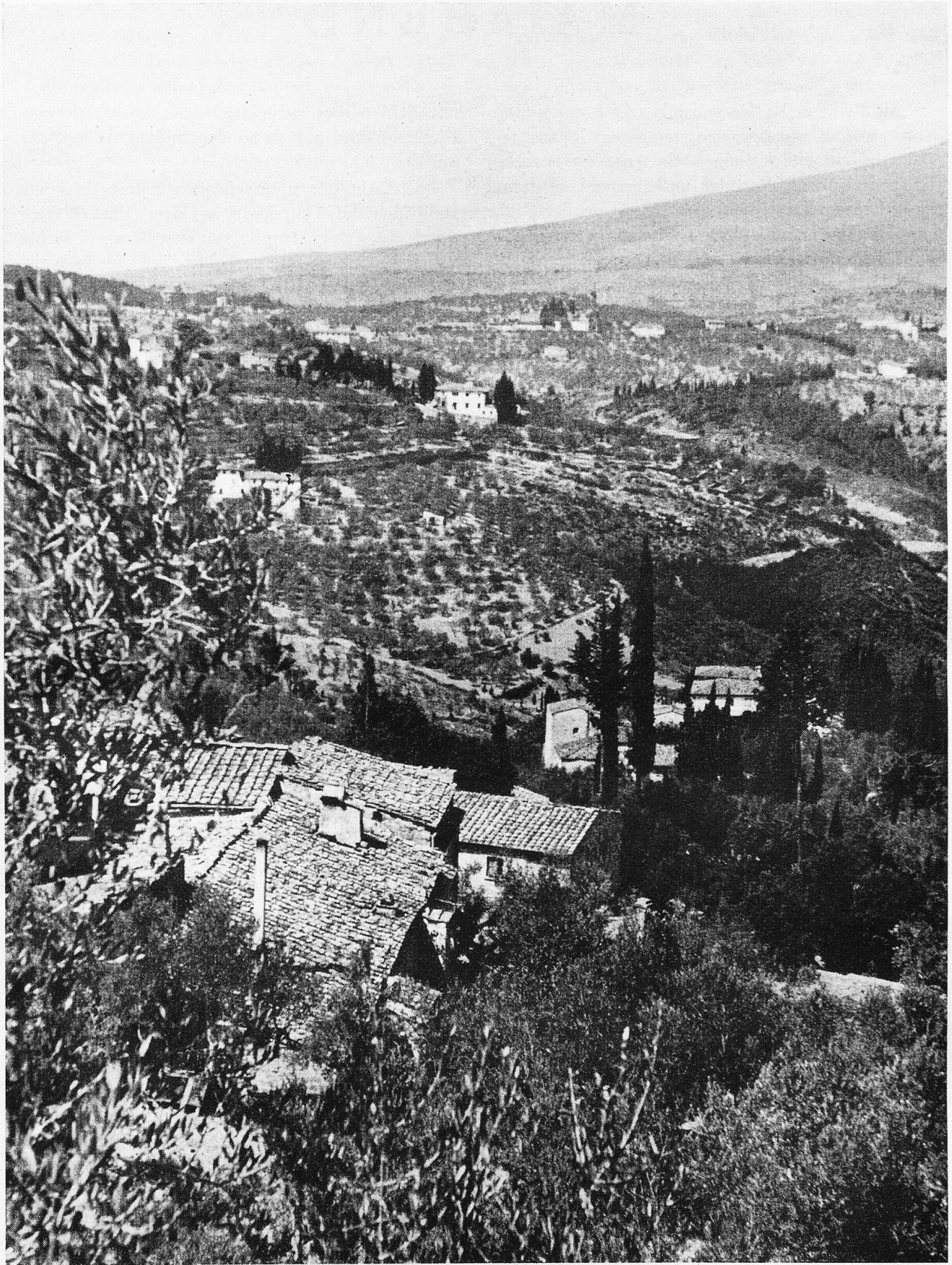
F I E S O L E