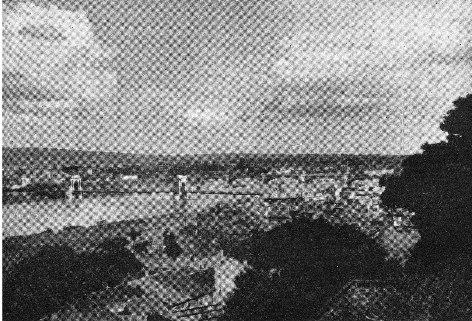
Blick von Beaucaire auf die Rhone .

hat, zu erfreuen. Wenn man Glück hat, sieht man die Arlesierin in ihrer Tracht, und dann erlebt man einen Frauentyp, der einem eine leise Ahnung von glücklicher Rassenvererbung bringt.