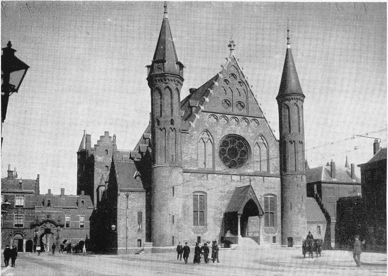
Der Ridderzaal, ein Teil des Binnenhofes im Haag, die Residenz Oraniens, nachdem Den Haag zur Hauptstadt der Niederlande gemacht worden war.

Bremstrommel zusammensetzen, ein paar Schrauben zu ergänzen und uns, nach Begleichung einer sehr bescheidenen Rechnung, mit bestem Dank unsererseits sowie herzlichen Wünschen seinerseits wieder dem Verkehrsstrom zu übergeben. Hoch klingt das Lied vom braven Mann!