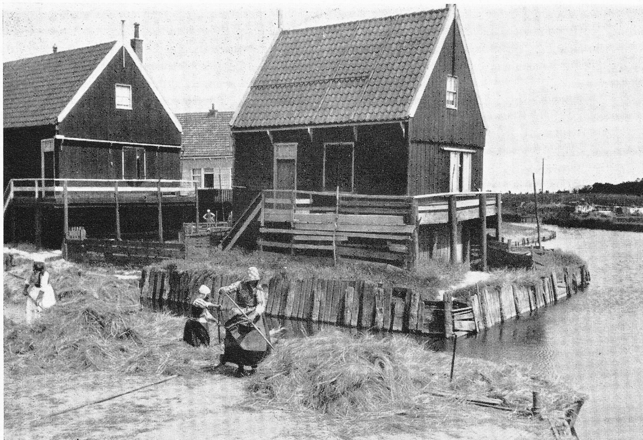
Marken, ein echtes Stück Holland in der Zuidersee. Typische Fischerhäuser, die wegen Wassergefahr als Pfählbauten errichtet sind.

trum Rotterdams ist jetzt in vollem Wiederaufbau begriffen und erhält sein Gepräge durch zahlreiche Hochhäuser sowie ein originelles, fahrverkehrsfreies Geschäfts- und Einkaufsviertel.