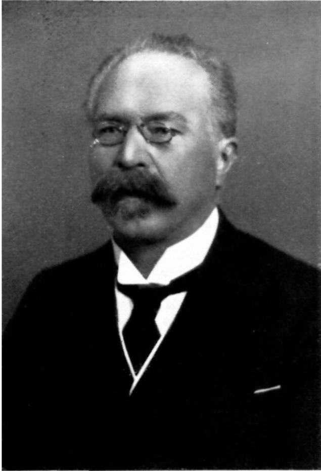
Alt Regierungsrat Ferdinand Buechler † 1853 — 1935