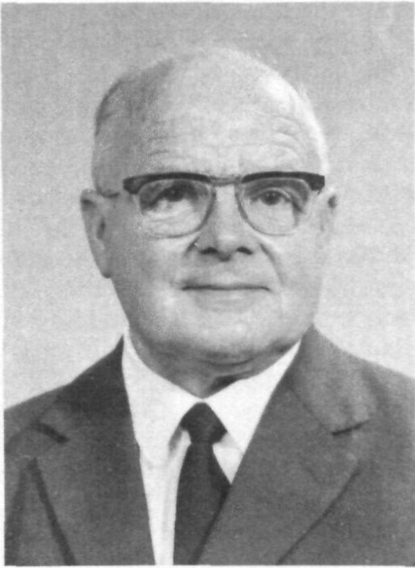
Regierungsrat Werner Hohl, Walzenhausen (1900—1977)