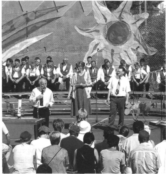
Der ökumenische Kirchentag in Appenzell mit dem Thema «Mer mached uuf!» stiess auf ein grosses, begeistertes Echo.

Appenzell erlebte am 14., 15. und 16. Juni einen informativen, besinnlichen, lebendigen, spielerischen und frohen ökumenischen Kir-