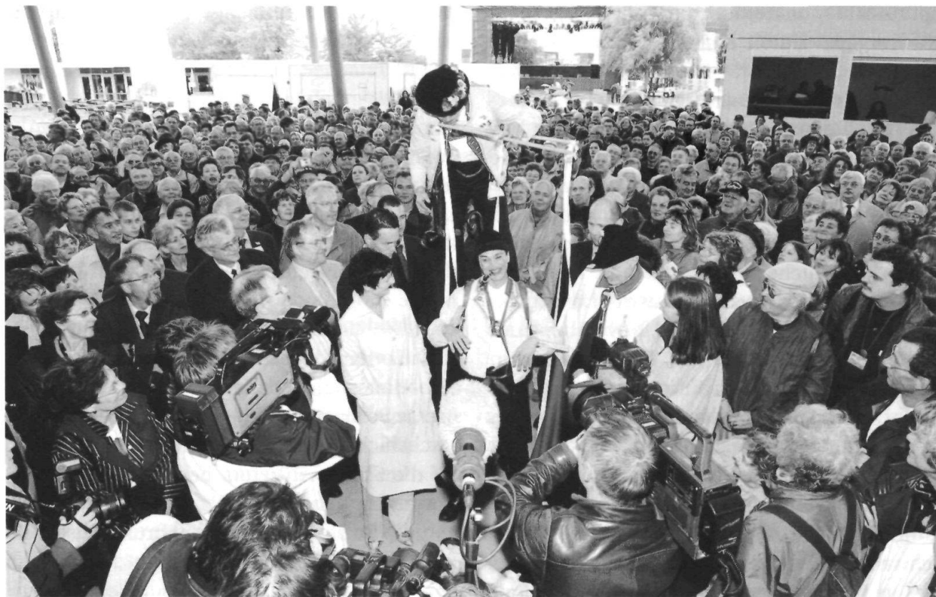
Die Appenzeller kamen am Expo.02-Kantonaltag in Neuenburg gut an.

Eine von der Wirtschaftsförderung Appenzell Innerrhoden herausgegebene Broschüre