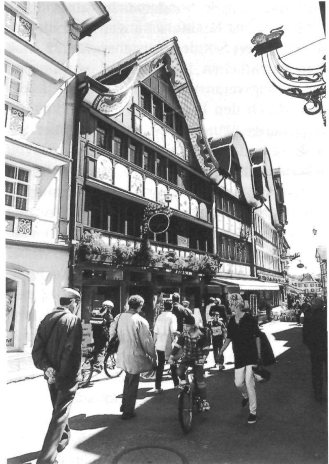
Der Anteil des Tourismus am Volkseinkommen beträgt in Appenzell Innerrhoden zehn Prozent.

Eine Studie der Universität St.Gallen erläuterte die volkswirtschaftliche Bedeutung des Tourismus im Appenzellerland. Danach werden in beiden Appenzell rund 100 Millionen Franken im Tourismus erwirtschaftet und 2000 Arbeitsplätze sichergestellt. Der Anteil des Tourismus am Volkseinkommen beträgt in Innerrhoden zehn Prozent.