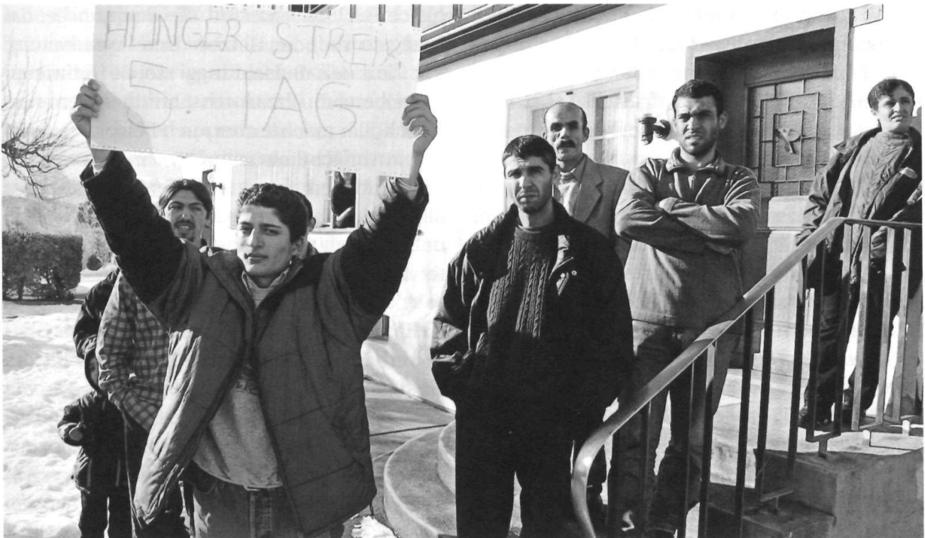
Unruhige Zeiten im Asylzentrum Mettlen in Appenzell: Hungerstreik und Demonstration sind neu für Innerrhoden.

waren 5 mehr als ein Jahr zuvor. Ende Jahr hielten sich noch 31 (34) Asyl suchende Personen im Kanton auf. 11 (8) abgewiesene Asylbewerber warteten insgesamt 248 (107) Tage im Kantonsgefängnis Appenzell und 45 (0) Tage im Flughafengefängnis Zürich auf die bevorstehende Ausschaffung ins Heimatland. – Bereits im Vorjahr wurde auf einen Trend zu immer schwierigerem Verhalten von Asylbewohnern hingewiesen. Und im Januar sowie im März sah sich denn auch der Kanton im Asylanten-Zentrum Mettlen mit einem Hungerstreik von Asylsuchenden konfrontiert, entstanden aus einer allgemeinen Unzufriedenheit. Um die Sicherheit für alle (Asylsuchende, Betreuer, Bevölkerung) sicherzustellen, mussten temporär umfangreiche und kostenintensive Massnahmen getroffen werden. Mit der Schaffung eines Betreuungskonzeptes und der Überarbeitung des Regelwerkes nach dem Grundsatz von Bonus/Malus wurde versucht, der allgemeinen Unzufriedenheit entgegenzuwirken. Einige Asylanten wurden in andere Kantone verlegt, neun weitere wurden in Baracken bei der Blei-