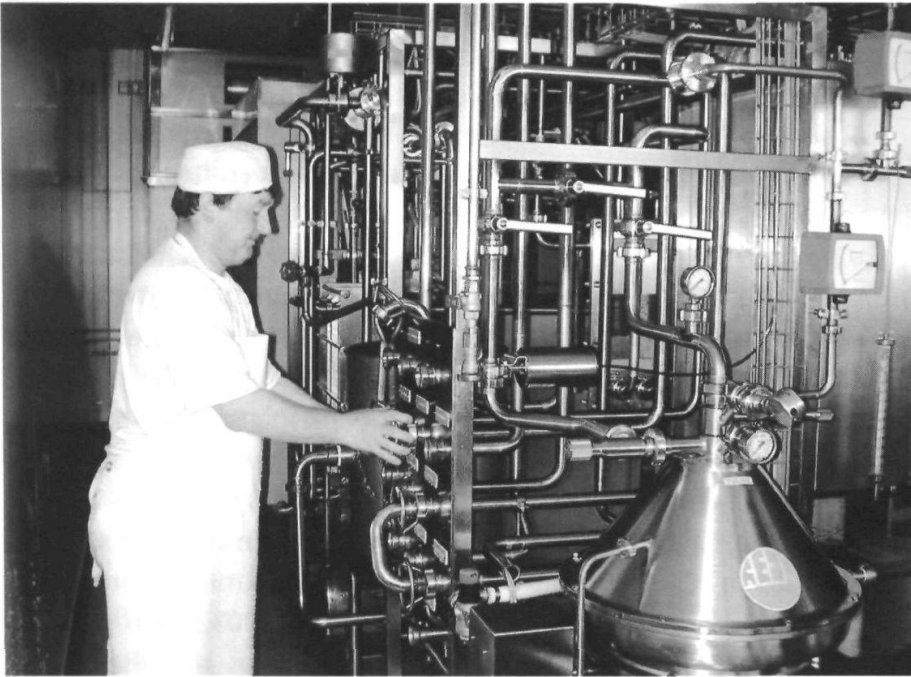
Ein neues Unternehmen in Appenzell gegründet zur Verarbeitung der Appenzeller Milch in Milcheisflocken für die Lebensmittelindustrie.

Den 100. Geburtstag gefeiert: Appenzeller Alpenbitter.