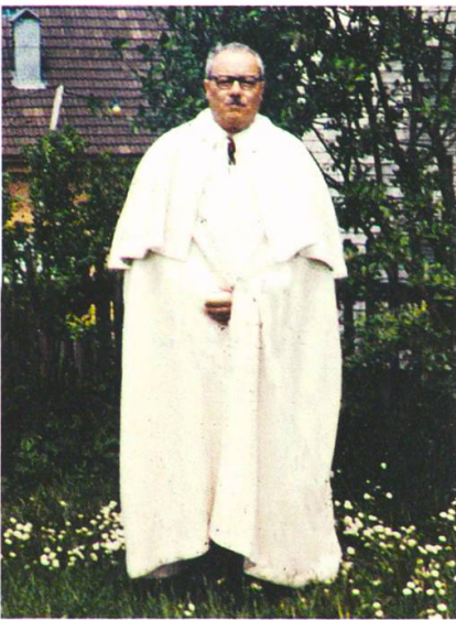
Festlicher Empfang für Dr. Gabriel Montenegro (1907–1969) aus Argentinien, 1965.