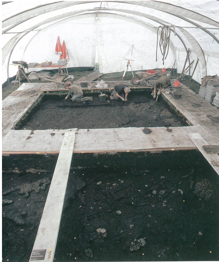
Abb. 4: Seedorf, Lobsigensee. Arbeitssituation im Jahr 2007.

höher gelegenen Partien der Fundstelle bietet sich heute ein Bild massiver Zerstörungen durch Austrocknung. In den tiefer liegenden Abschnitten, die sich noch im Bereich des Grundwassers befinden, dürfte hingegen die Erhaltung noch perfekt sein.