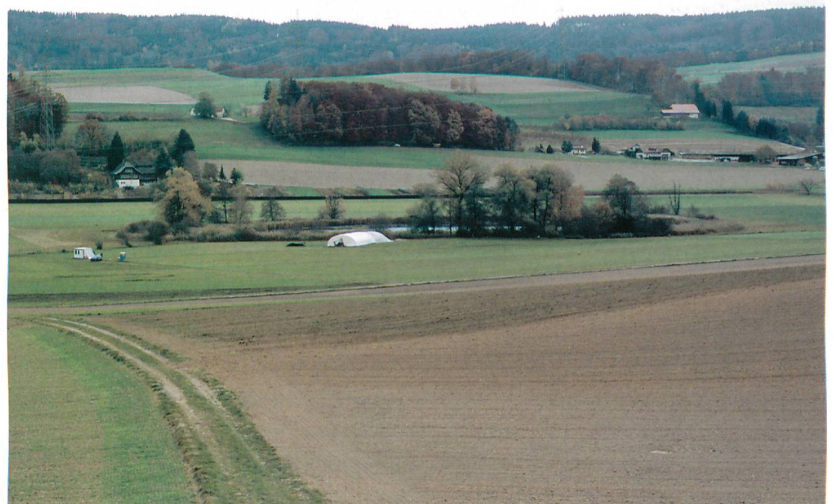
Abb. 3: Seedorf, Lobsigensee. Lage der Grabungsfläche am Ufer des Sees.