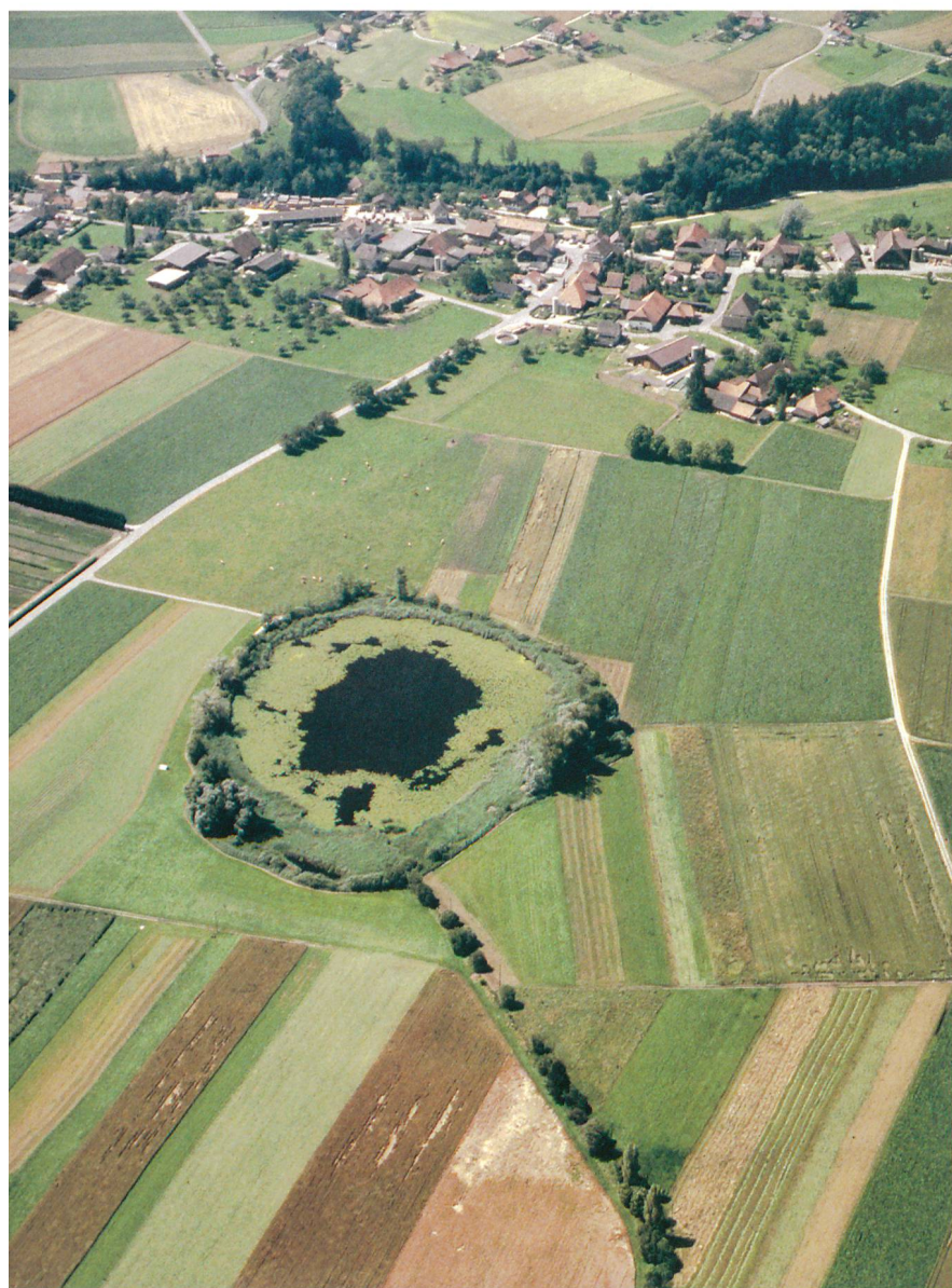
Abb. 1: Seedorf, Lobsigesee. Luftaufnahme des Sees. Blick in Richtung Südwesten zum Dorf Lobsigen. Im Vordergrund der nach Norden abfliessende Seebach. Die Fundstelle befindet sich in den Wiesen nordwestlich des Sees.

Die neolithische Fundstelle am nordwestlichen Ufer des Lobsigesees (Abb. 1) ist seit einer Sondierung des Bernischen Historischen Museums von 1908 bekannt. Weitere, insgesamt sehr kleine Ausgrabungen fanden 1924 und 1953 statt. Bis Mitte der 1960er Jahre meldeten Privatsammler immer wieder Einzelfunde, die beim Pflügen an die Oberfläche gelangten. Die zentralen Teile der Fundstelle befinden sich seit langem oberhalb des Grundwasserspiegels und unterliegen damit einer zerstörerischen Austrocknung. Davon betroffen sind insbesondere die früher hervorragend erhaltenen Holzkonstruktionen und organisches Material. Mit Sondierungen im Sommer 2005 wurde zunächst die genau Lage und die Ausdehnung der Fundstelle erfasst. Mit der von August bis Dezember 2007 dauernden geplanten Rettungsgrabung unter der Leitung von Andreas Marti sollten vor allem Erkenntnisse zum Erhaltungszustand gewonnen werden.