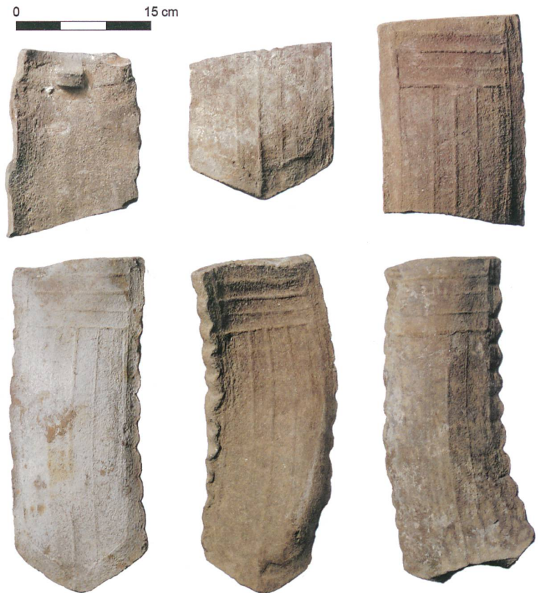
Abb. 5: Sutz-Lattrigen, Ziegelhütte. Fehlbrände von Dachziegeln, wohl Produkte der Ziegelei. Die geringe Zahl der gefundenen Fehlbrände spricht für eine Deponierung der typischen und massenhaft anfallenden Abfälle an anderer Stelle.

Andres Moser, Die Kunstdenkmäler des Kantons Bern. Landband III. Der Amtsbezirk Nidau 2. Teil. Die Kunstdenkmäler der Schweiz 106. Bern 2005.