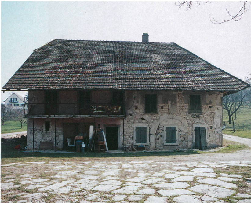
Abb. 1: Sutz-Lattrigen, Ziegelhütte. Der bauliche Zustand des alten Ländtheuses im Jahr 2007. Ansicht von Norden.