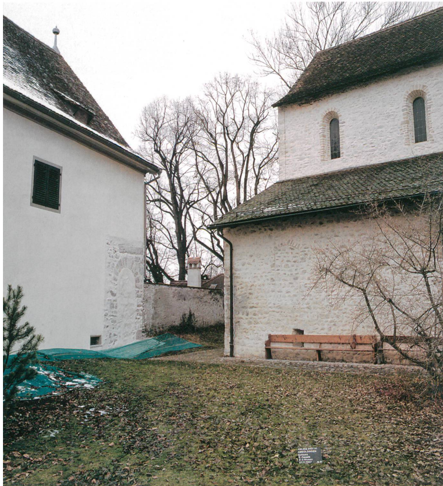
Abb. 1: Schloss Amsoldingen. Die frisch restaurierte Ostfassade mit dem zugemauerten romanischen Eingangsportal. Rechts die frühromanische Stiftskirche.